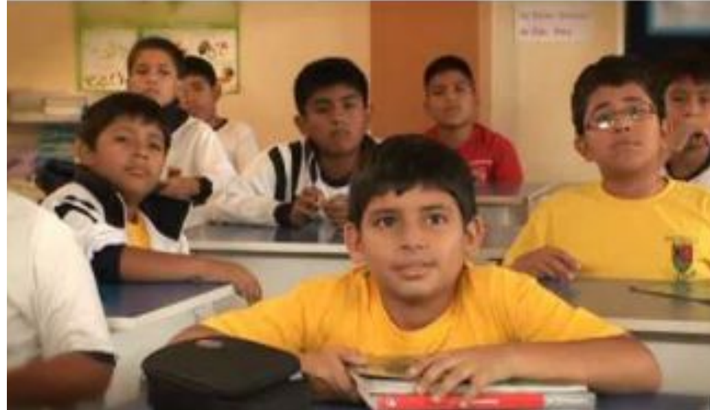
Video: Orgullosos de mi padre (Proética 2010)