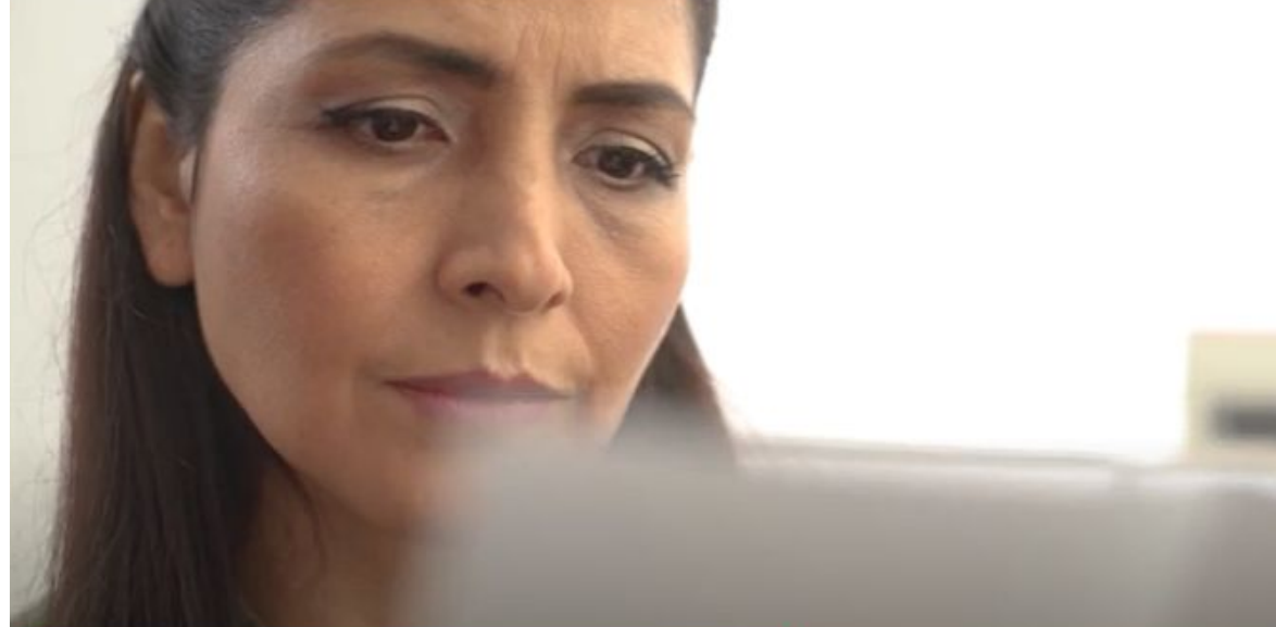
Video: Por un Perú íntegro (PCM 2021)