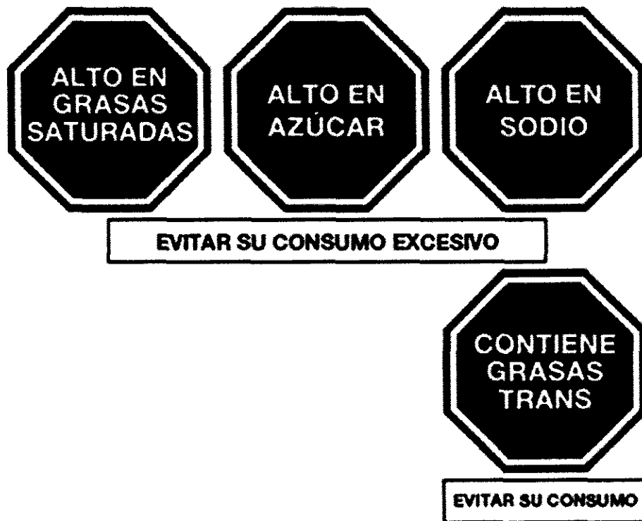
Gráfico 1: Advertencias publicitarias

El contenido de las advertencias publicitarias es el señalado en el Gráfico 1: