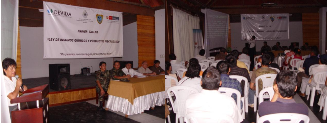
Taller Ley de Insumos Químicos y Productos Fiscalizados para usuarios de IQPF y Autoridades de Tingo María