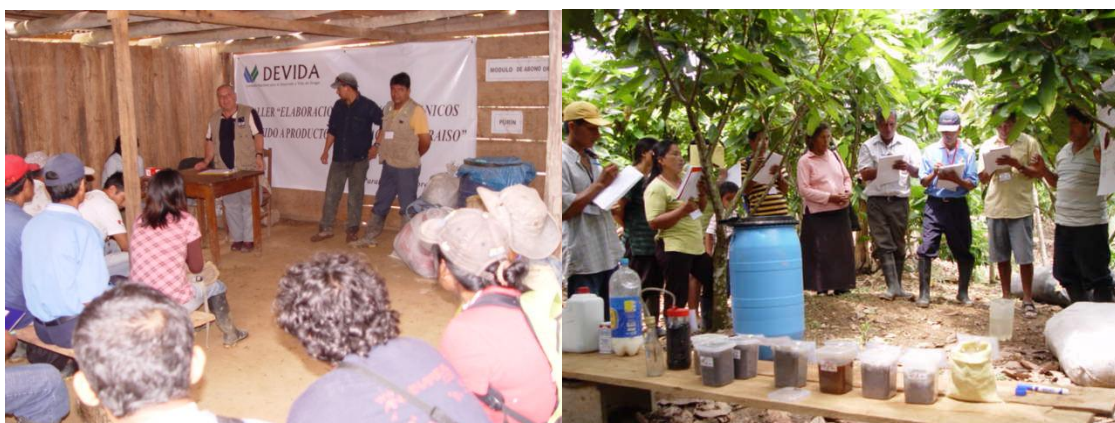
Taller elaboración de Abonos Orgánicos en Paraíso – Tingo María.