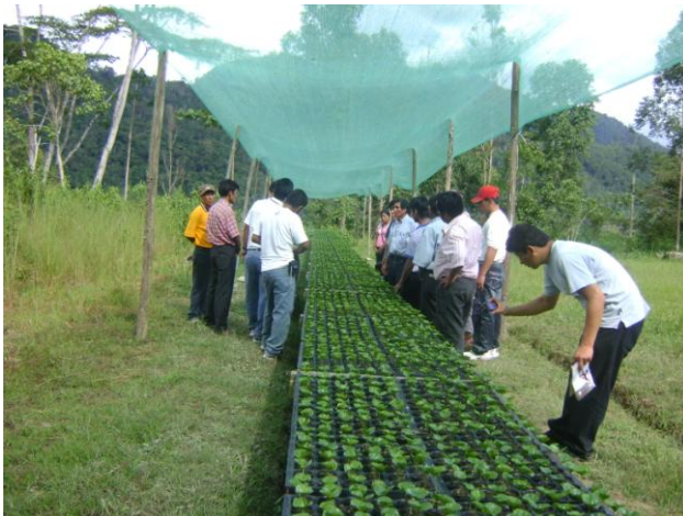
Pasantía: "Intercambio de Experiencias Exitosas sobre Manejo Tecnológico del Café Bajo Sistemas Agroforestales entre Productores de selva Central y Ucayali"