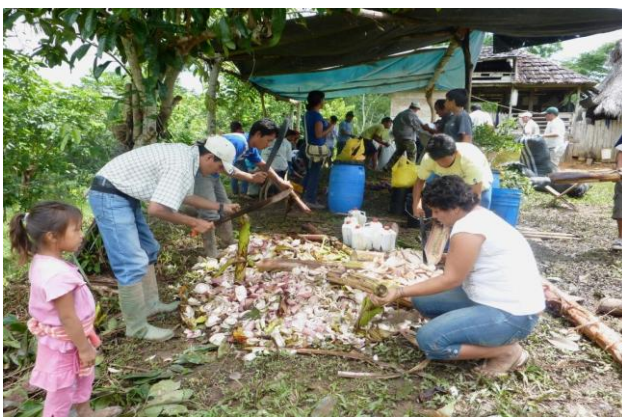
"Reforzamiento de las Capacidades de Producción y Aplicación de Abonamiento Orgánico en los participantes de los Sub Proyectos de Cacao, Café y Palma en el distrito de Padre Abad.