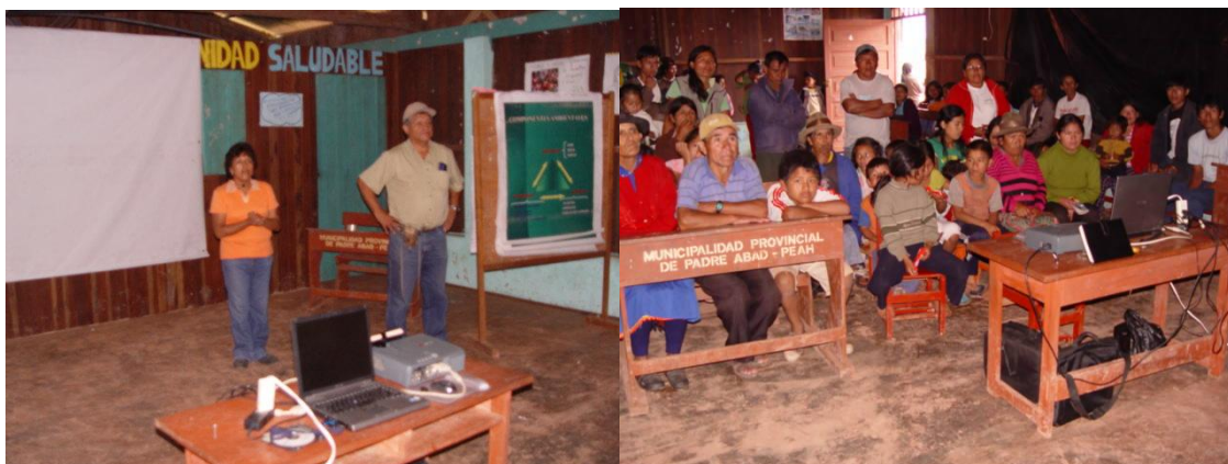
Charlas de capacitación y orientación ambiental en Margarita – Tingo María, dirigido a la población en general.