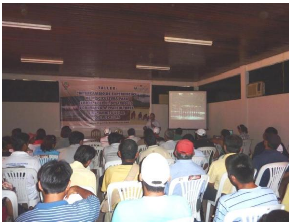
Taller: "Intercambio de Experiencias en Piscicultura para Fortalecer el Desarrollo Económico a Piscicultores del ámbito de la OD Pucallpa"