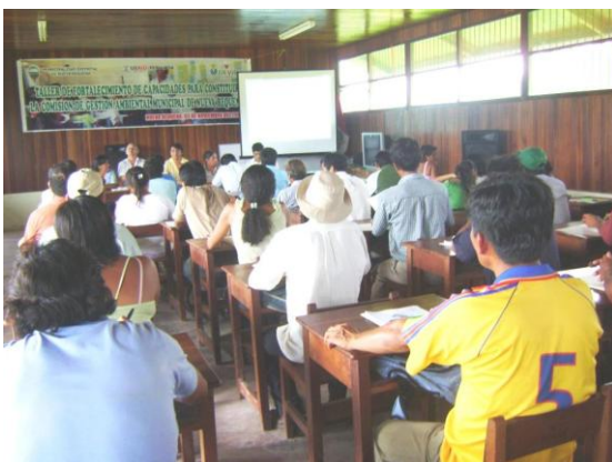
Taller: "Fortalecimiento de capacidades para Constituir la Comisión de Gestión Ambiental Local de los Distritos de Curimana, Irazola y Nueva Requena"