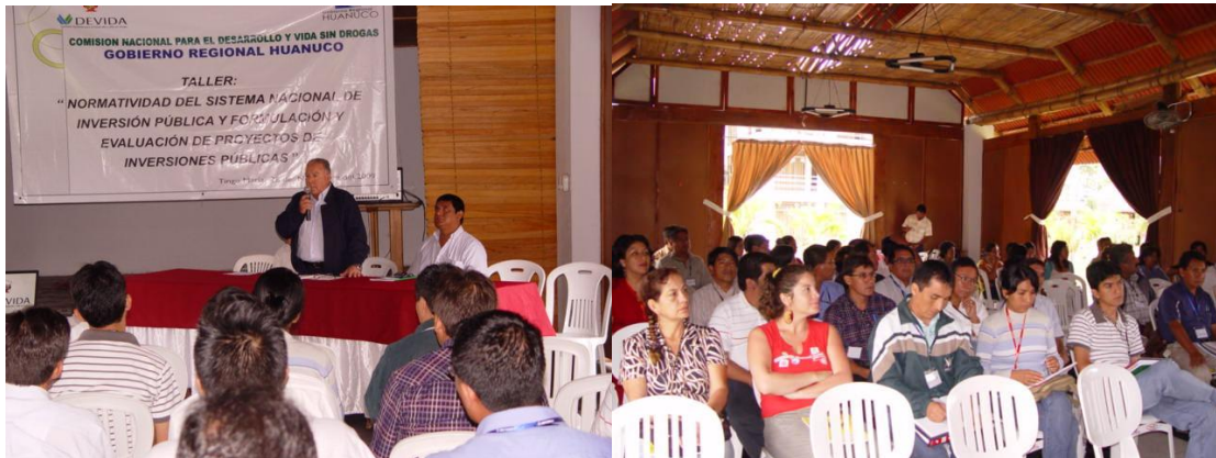
Taller Normatividad del Sistema Nacional de Inversión Pública y Evaluación de Proyectos de Inversiones Públicas