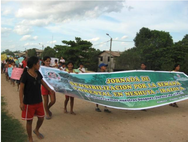
Sensibilización a las autoridades y sociedad civil organizada de los distritos de Curimana e Irazola sobre la conservación de los recursos forestales