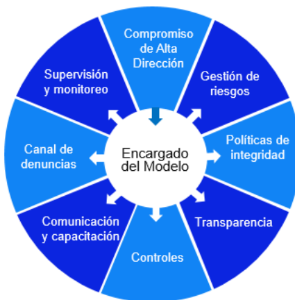
Gráfico N° 1 Modelo de Integridad

Es la herramienta que permite medir la adecuación de la entidad al estándar de integridad a través del desarrollo de los componentes y subcomponentes del modelo de integridad, evidenciando las brechas y oportunidades de mejora en su implementación.