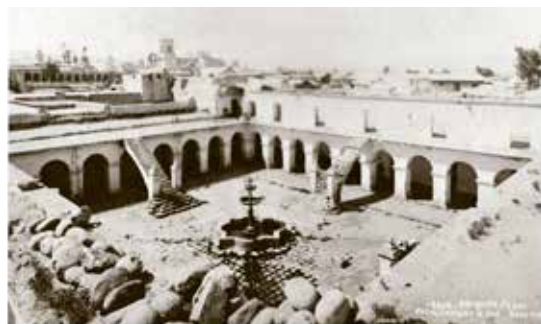
Claustro de San Agustín, Arequipa, s. XIX

Nada confiado en mis propias fuerzas, y atemorizado con la magnitud de la obra, emprendí el trabajo con desconfianza y timidez, pensando que fuera exclusivamente para mi uso particular. Ocultaba de todos mi proyecto, porque me atemorizaba la idea de ser descubierto en mi camino, usurpando los derechos de esclarecidos varones que han envejecido en el estudio de las leyes. Solo después de dos años de trabajo me resolví a presentar a algunas personas los borradores que tenía formados, y habiendo obtenido su aprobación, me decidí a ofrecer al público el resultado de mis tareas.