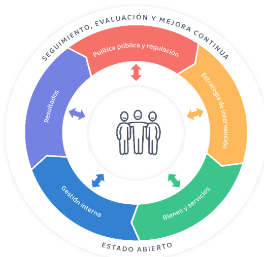
Gráfico N° 2: Modelo conceptual de la PNMGP al 2030

En el marco del paradigma de la nueva gobernanza, la PNMGP al 2030 plantea un modelo conceptual basado en la lógica de la cadena de valor público, el cual facilita contar con una aproximación holística para comprender las decisiones de política y estrategias de intervención que se adoptan desde el Estado para resolver un determinado problema público; el funcionamiento de las entidades públicas (en términos de su gestión interna), los productos que generan (en términos de los bienes, servicios y regulaciones) y los resultados que permitirán generar los cambios esperados en el bienestar de las personas y de la sociedad. Del mismo modo, a través de dicho enfoque, se busca transmitir que las intervenciones públicas en el territorio no son solo el resultado del rol preponderante que asume una entidad pública, sino que resulta – sobre todo – de los distintos procesos de gobernanza que se establezcan entre entidades públicas, organizaciones del sector privado y las personas (PNUD, 2015). Véase gráfico N° 2: