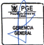
MARIA AURORA CARUA JULCA QUISPE Procuradora General del Estado