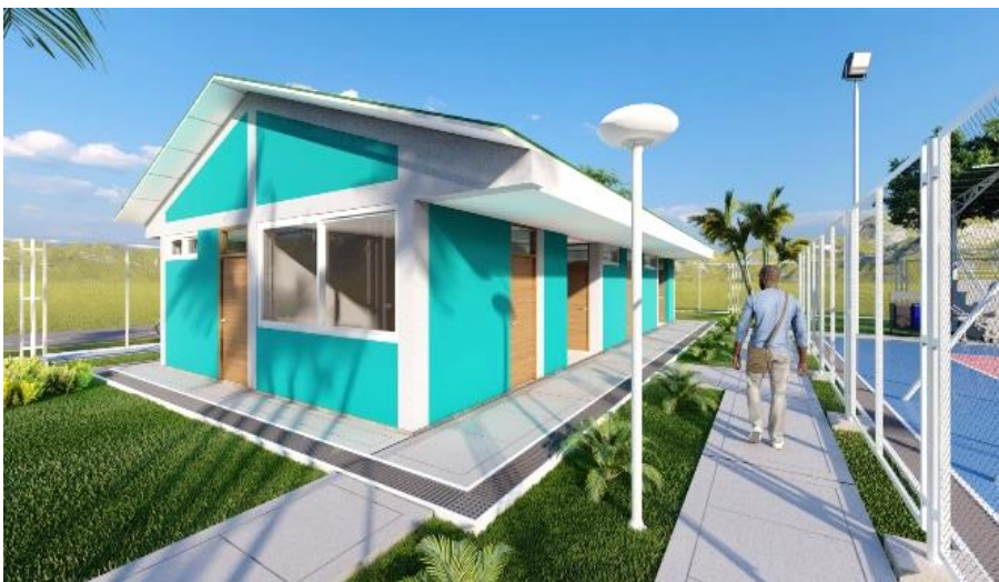
Módulo de servicios con diseño bioclimático