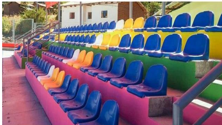
Butacas de PVC con respaldar en gradería