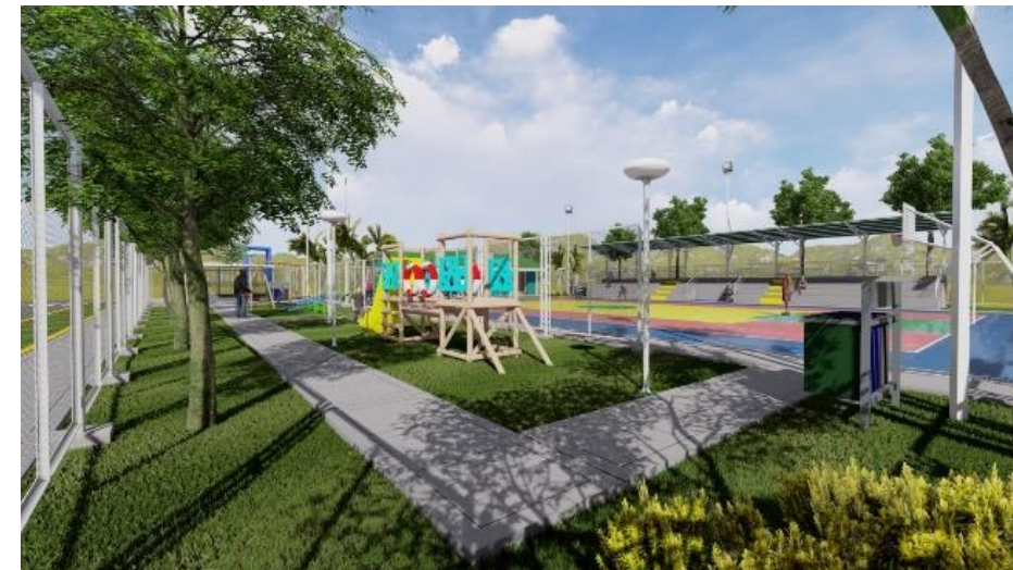
Las áreas verdes podrán incluir mobiliario urbano (juegos infantiles / mini gimnasio / descanso)