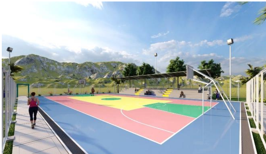
Losa de concreto coloreado (19x32 m – incluye zona de seguridad)