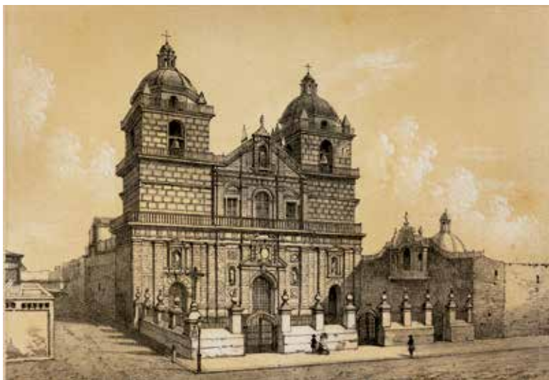
Iglesia de San Pedro, Lima. En: Mariano Felipe Paz Soldán, Atlas geográfico del Perú , 1865.