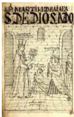
Guaman Poma, 1615