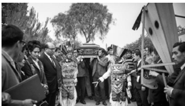
Funerales de Arguedas, Lima, 1969

Si bien Arguedas se convirtió en un protagonista de la cultura peruana en la etapa final de su vida, no menos cierto es que esta fue también una década dura y dolorosa para el escritor debido a su precario estado de salud. A esta época pertenecen la novela El sexto (1961) 2 , el relato La agonía de Rasu Ñiti (1962) y sus dos últimas novelas, Todas las sangres (1964) y El zorro de arriba y el zorro de abajo (1971). Todas las sangres constituye un vasto mosaico de la sociedad peruana de los años 60 y narra el impacto de la modernidad en la sociedad tradicional de la sierra. El fin del feudalismo está dramatizado por las disputas entre los hermanos Fermín y Bruno Aragón,