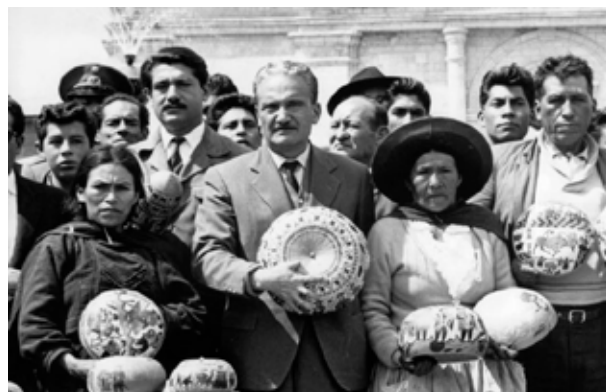
En la feria dominical de Huancayo

membros de la familia terrateniente más poderosa de la región de San Pedro de Lahuaymarca. Lo que propicia la ruptura del viejo orden feudal es el advenimiento de un capitalismo incipiente, representado por Fermín, dueño