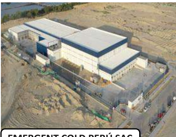
EMERGENT COLD PERÚ SAC