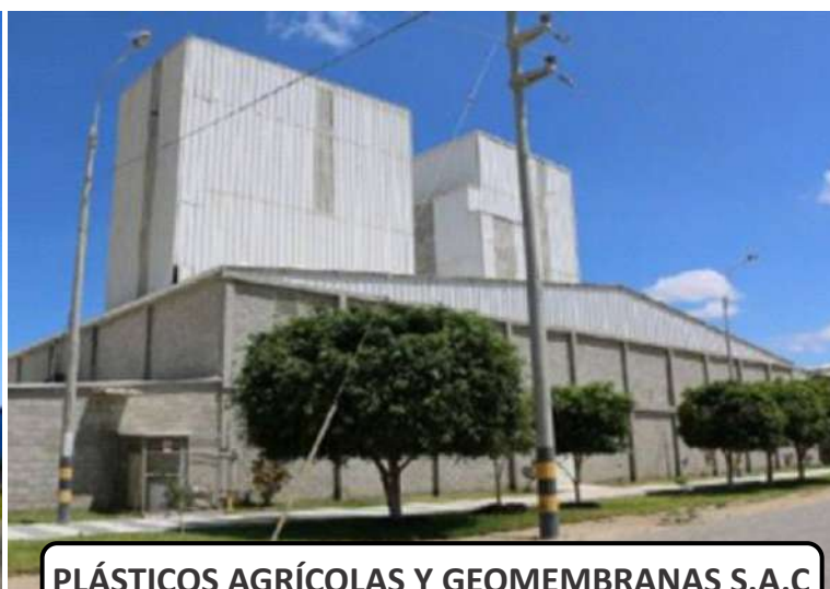
PLÁSTICOS AGRÍCOLAS Y GEOMEMBRANAS S.A.C