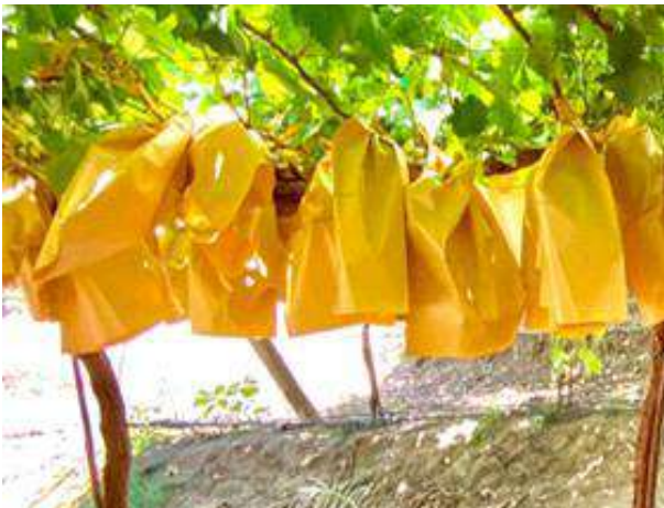
PRODUSERVIS: Bolsa protectora de frutas-Cubre racimos

Medlog Piura S.A.C es subsidiaria de Medlog S.A, empresa transnacional con presencia en más de 70 países y que forma parte del grupo MSC Mediterranean Shipping Company.