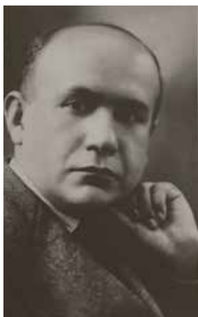
Encinas ca. 1930

Toda esa experiencia vital que Encinas desplegó en cuatro años de labor docente se encuentra contenida, bajo una estructura precisa, en Un ensayo de escuela nueva en el Perú . La distancia le permitió dejar lo esencial. Se trató, en realidad, de un balance pedagógico que analizaba los tres factores que Encinas juzgaba como fundamentales en toda política educativa: el maestro, la escuela y el estudiante. Aconsejó al maestro «conocer la historia de su país» y «colaborar en la solución de cuestiones que agitan la vida nacional». Por supuesto, se refería al problema de la educación del niño indígena, pues la escuela tradicional no le ofrecía un contenido acorde a su realidad: «Arrancar al indio del medio en que vive, apartarlo de sus diarias ocupaciones, limitar su actividad cerrándolo dentro de los cuatro muros de una sala destartada, poniéndole ante los ojos las 24 letras del alfabeto que nada significan para él, es a todas luces un absurdo». Por esa razón, consideró que la escuela rural debía organizarse socialmente, fomentando la mejora en la agricultura y la domesticación de animales, la higiene y el deporte, la protección a la infancia, a la vejez y a los enfermos. Así, cuando la institución educativa no sea un elemento hostil a su manera de vivir, sino que, por el contrario, enriquezca su realidad, el indígena se irá involucrando con mayor empeño en las actividades de aprendizaje.