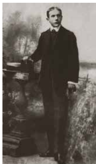
Encinas en 1905

A finales del siglo XIX y durante los primeros años del XX, la región altiplánica experimentó, por cierto, una serie de rebeliones y levantamientos campesinos. Puno era entonces un departamento con escaso desarrollo industrial, caracterizado más bien por una economía agropecuaria y una población donde primaba el analfabetismo. No obstante, el alza de los precios de