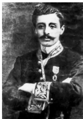
En traje diplomático, años 20

Ingresó luego a la Universidad de San Agustín, matriculándose tanto en la Facultad de Letras como de Ciencias. Se daba tiempo también para desarrollar sus habilidades en el terreno de las artes, en particular la acuarela y la escultura, en el flamante Centro Artístico de Arequipa. Sus sobresalientes méritos académicos le valieron, en 1894, que el gobierno de Remigio Morales Bermúdez le otorgara una beca para estudiar en Francia. Continuando un curso vital signado por la multiplicidad de talentos, en París estudió arquitectura y construcción en la Escuela Nacional de Artes Decorativas y, a partir de 1897, ingeniería química en el Instituto de Química Aplicada de la Universidad de la Sorbona. Allí conocería a lo más granado de la ciencia francesa, con celebridades como Maurice Berthelot o Pierre Curie. La beca no había durado mucho, así que para ganarse la