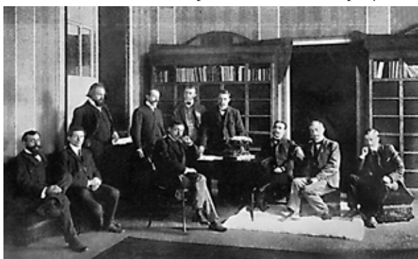
Con colegas ingenieros, Lima, ca. 1905

Por aquellos años se produjo un hecho capital. El diario El Comercio publicó una entrevista al inventor austriaco Max Valier, quien, en el contexto del primer vuelo transatlántico de Charles Lindbergh, sostuvo que su propio proyecto de avión-cohete (basado a su vez en los trabajos del físico alemán Hermann Oberth) podía hacer el trayecto de Berlín a Nueva York en menos de dos horas (frente a las 33 empleadas por Lindbergh), con base en la utilización de cohetes impulsados con motores de combustible líquido. Al enterarse de ello, Paulet dirigió una carta a El Comercio el 7 de octubre de 1927, reivindicando que él había diseñado un avión-cohete superior tres décadas antes, pero no había encontrado el financiamiento necesario para materializar su proyecto.