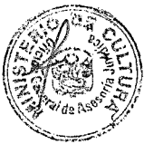
LESLIE CAROL URTEAGA PEÑA Ministra de Cultura