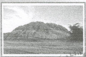
HUACA LA PAVA Pirámides Arqueológicas en los caseríos La Pava Solecapne, Huaca de Toro y Pueblo Nuevo