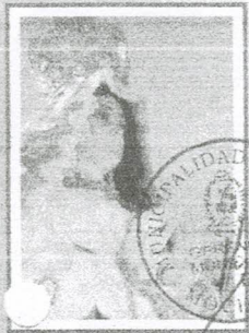
INMACULADA CONCEPCIÓN DE MARÍA Patrona de Nuestro Distrito