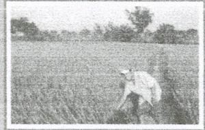
FERTILIDAD DE SUS TIERRAS Nuestra Economía esta basada en la agricultura