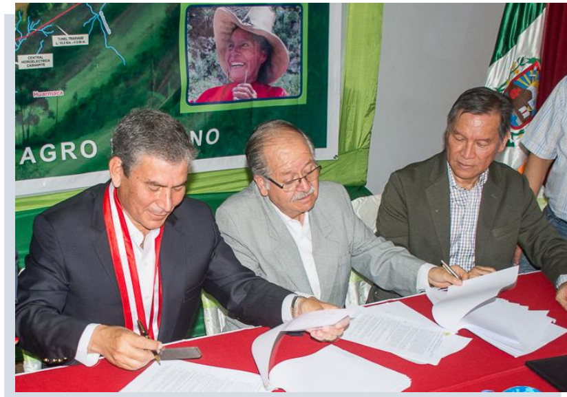
Contrato celebrado entre el PEIHAP del Gobierno Regional Piura y el Consorcio Obrainsa-Astaldi, para Ejecución de Obra "Ejecución del Componente I: Construcción de la Presa Tronera Sur y Túnel Trasandino del PEIHAP"

Con la solicitud de adelanto directo del Consorcio Obrainsa-Astaldi, adjuntando las Cartas Fianzas y la factura respectiva, la entidad realizó el pago por el importe de S/. 70, 000,000.00.