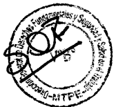
SYLVIA E. CÁCERES PIZARRO Ministra de Trabajo y Promoción del Empleo