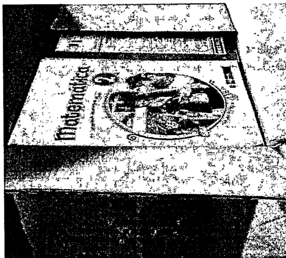
Rótulo de la caja indica Cuaderno de autoaprendizaje matemática 4º grado, pero contiene de 2º grado