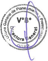
NELLY PAREDES DEL CASTILLO MINISTRA DE DESARROLLO AGRARIO Y RIEGO