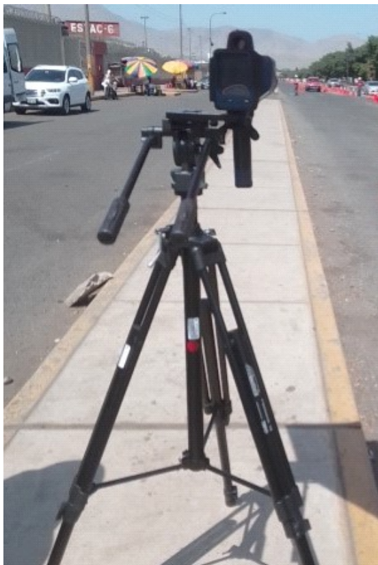
ILUSTRACIÓN DEL MEDIDOR DE VELOCIDAD PORTÁTIL CON NÚMERO DE SERIE TC010169