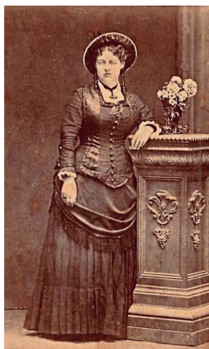
En Lima, 1877

Su inclinación por la escritura fue temprana, así lo demuestran sus pinitos en el periódico escolar del colegio cuzqueño Nuestra Señora de las Mercedes. Una circunstancia que tuvo que afrontar fue el fallecimiento de su madre, Grimesa Usandivaras Gárate, pues eso la obligó a abandonar la escuela para ponerse al cuidado de sus tres hermanos menores. En algún momento intentó viajar a Estados Unidos para iniciar estudios de Medicina, pero no pudo hacerlo por la firme oposición de su padre. La bien surtida biblioteca familiar le permitió, empero, ahondar en la lectura de autores clásicos y algunas novedades literarias. En 1871, se casó con el comerciante británico Joseph Turner, con quien residió en el pueblo de Tinta, también en el Cuzco, donde se familiarizó con el tema del enganche del campesinado indígena para el acopio de la lana que se exportaba al mercado externo, e inspiraría parte de su obra. En 1876, funda el quincenario El Recreo . El Cuzco veía por primera vez una publicación de carácter literario y científico dirigida por una mujer. Cabe añadir que el primer número de esta publicación dedicaba un espacio más que significativo a Francisca Zubiaga, esposa del militar y presidente de los turbulentos inicios de la República Agustín Gamarra, conocida con el apelativo de «La Ma-