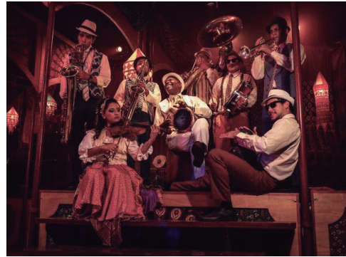
La Tarumba.