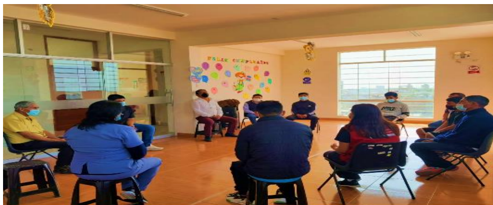
Figura N°1 Estrategia de Intervención Terapéutica para Adolescentes con Niveles de Riesgo Alto y Moderado