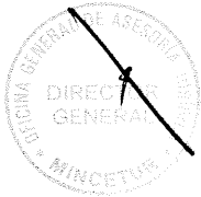
JUAN CARLOS MATHEWS SALAZAR Ministro de Comercio Exterior y Turismo