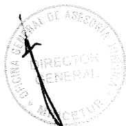
Raúl Ricardo Pérez Reyes Espejo Ministro de la Producción Encargado del Despacho de Comercio Exterior y Turismo