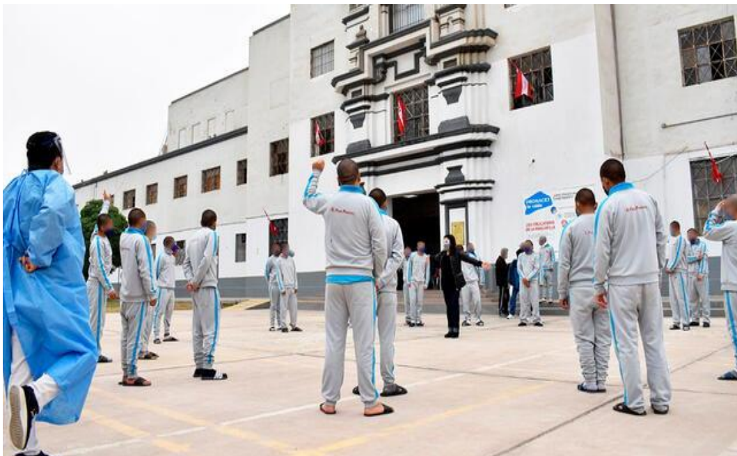
Figura N.º1 Centro Juvenil Lima – Actividades recreativas