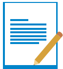
Copia de contratos y montos acordados entre la municipalidad y determinada empresa