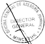
JUAN CARLOS MATHEWS SALAZAR Ministro de Comercio Exterior y Turismo