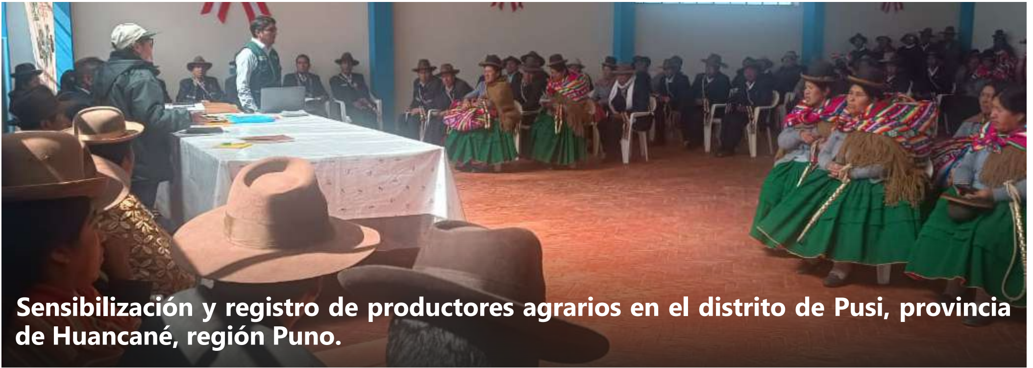
Sensibilización y registro de productores agrarios en el distrito de Pusi, provincia de Huancané, región Puno.