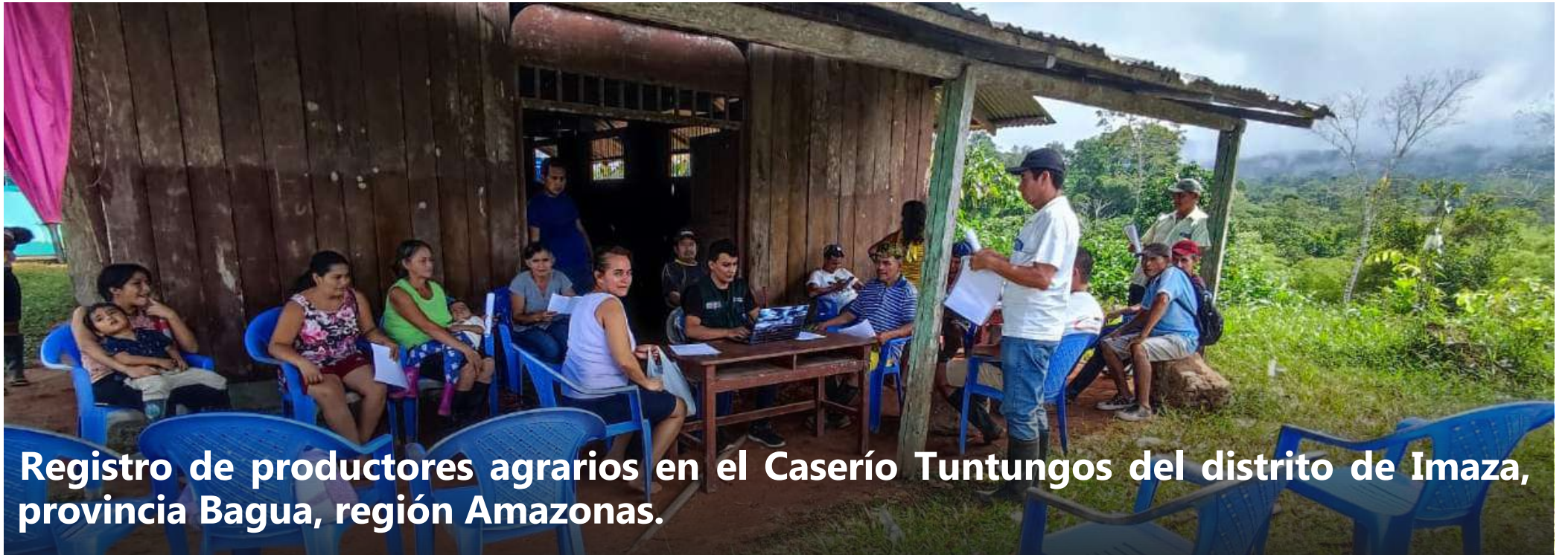
Registro de productores agrarios en el Caserío Tuntungos del distrito de Imaza, provincia Bagua, región Amazonas.