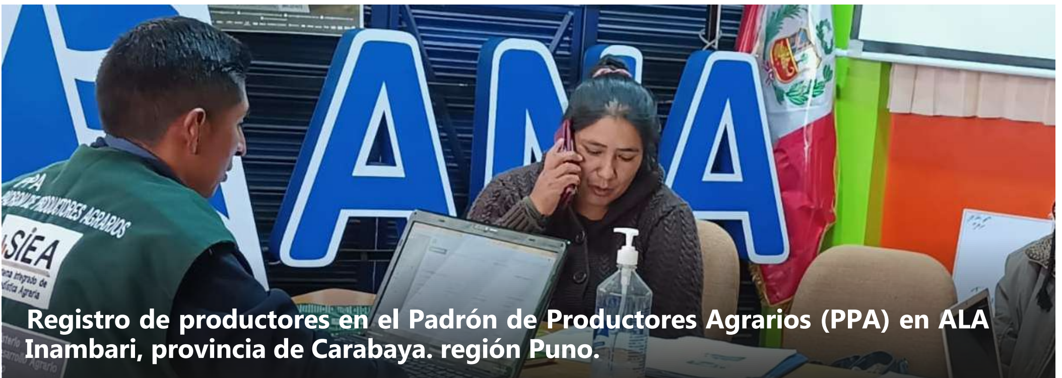
Registro de productores en el Padrón de Productores Agrarios (PPA) en ALA Inambari, provincia de Carabaya. región Puno.