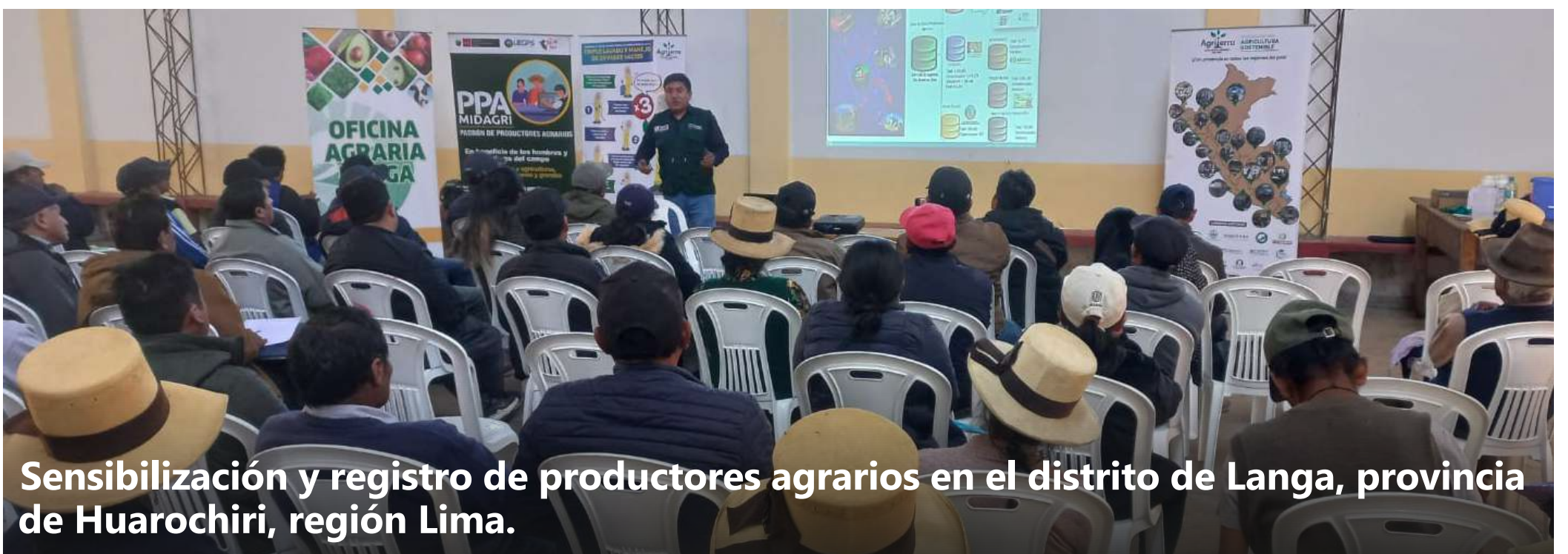
Sensibilización y registro de productores agrarios en el distrito de Langa, provincia de Huarochiri, región Lima.