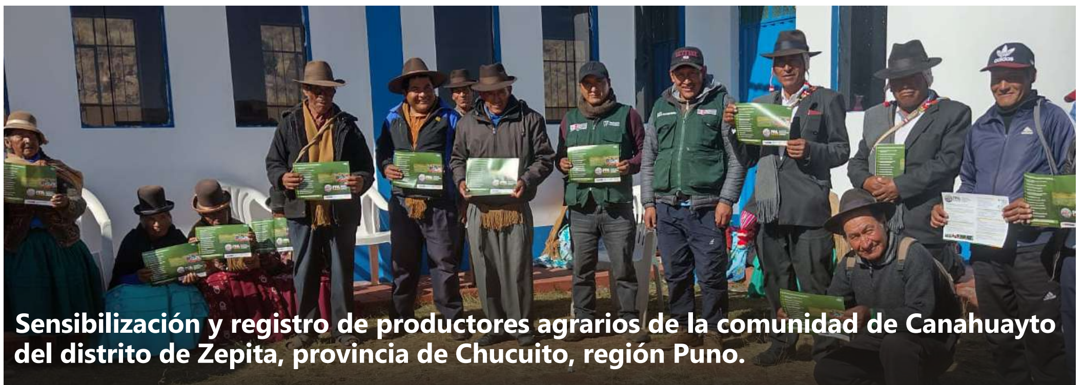
Sensibilización y registro de productores agrarios de la comunidad de Canahuayto del distrito de Zepita, provincia de Chucuito, región Puno.