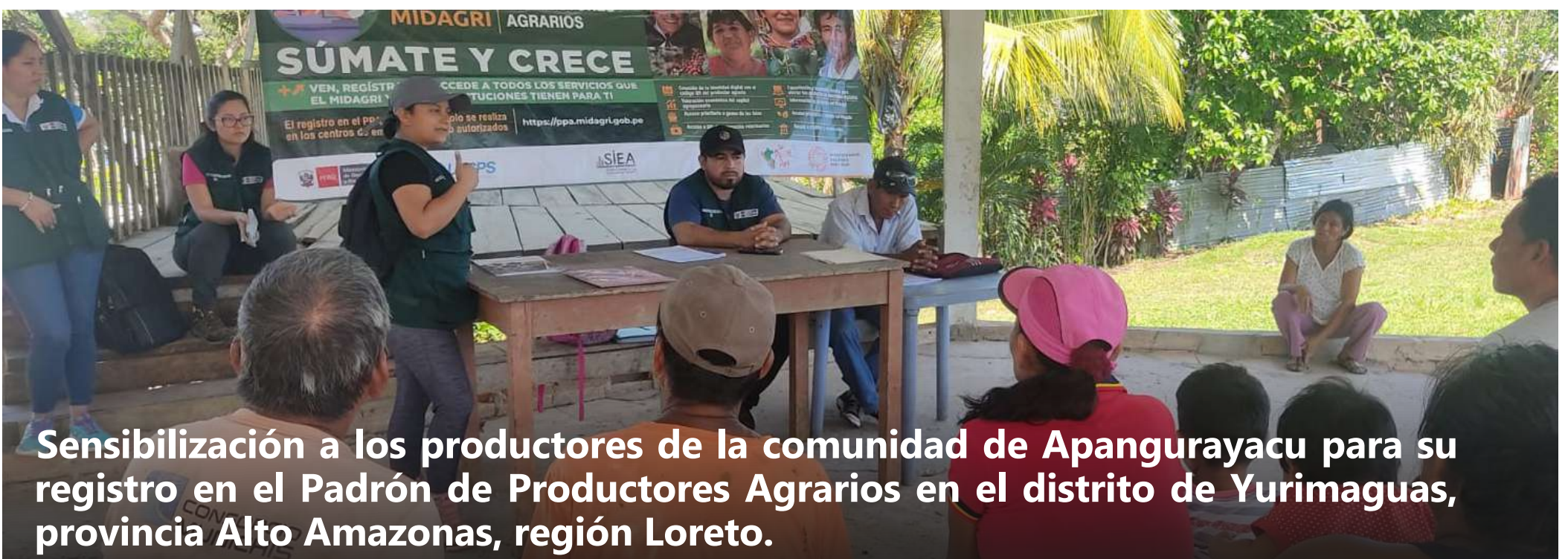
Sensibilización a los productores de la comunidad de Apangurayacu para su registro en el Padrón de Productores Agrarios en el distrito de Yurimaguas, provincia Alto Amazonas, región Loreto.