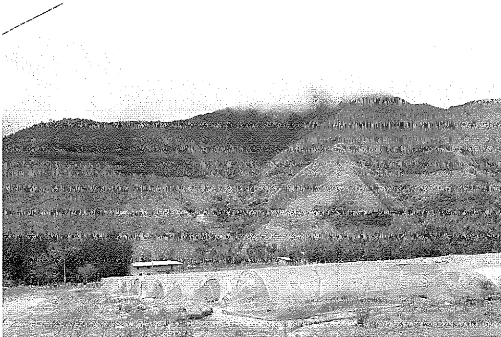
Instalación de Viveros Forestales