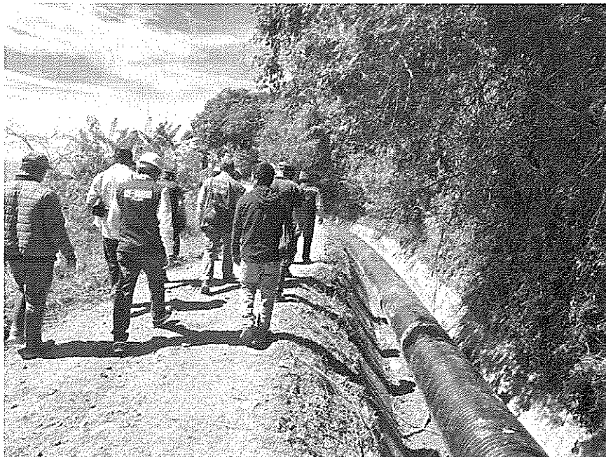
Instalación de tubería