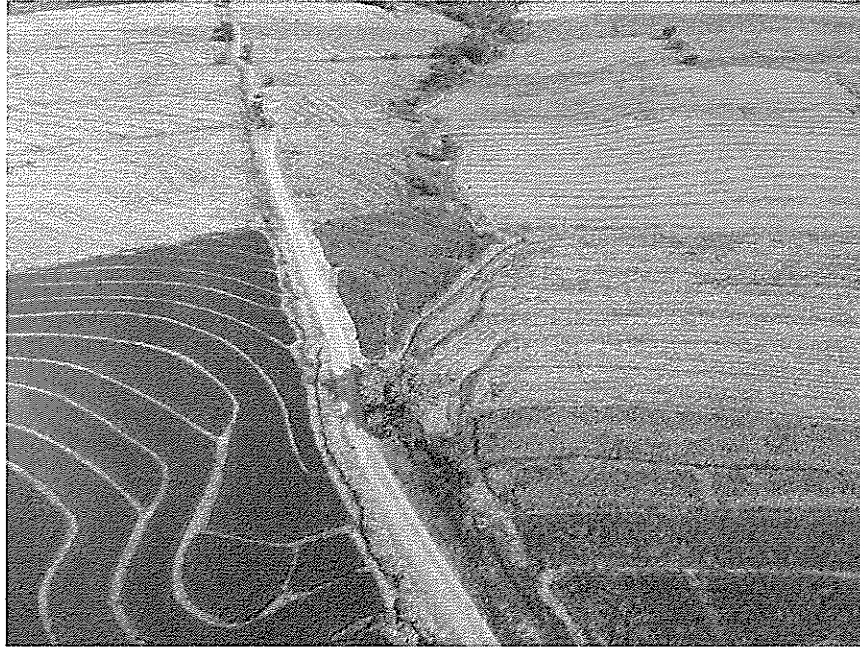
Vista panorámica del trazo del canal

con respecto al PIM. El avance físico es de 4.899 Km de mejoramiento de canales de riego, que representa el 30.55% de avance de la meta física anual.