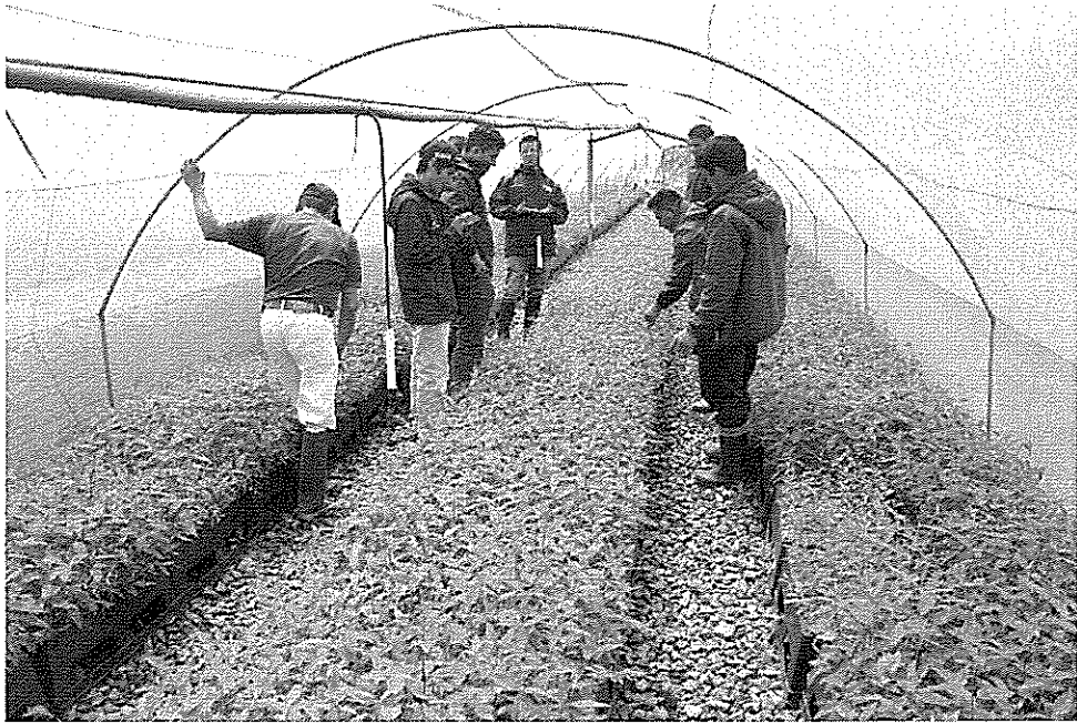
Producción de Plantones