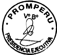
JUAN CARLOS MATHEWS SALAZAR Ministro de Comercio Exterior y Turismo