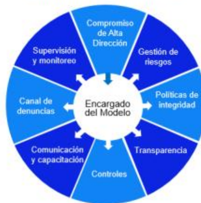
Gráfico N° 1 Modelo de Integridad

La etapa de seguimiento comprende el monitoreo, recomendaciones para identificar oportunidades de mejora, cierre de brechas y elevar los niveles de aplicación de los estándares que conduzcan a fortalecer la cultura de integridad en la entidad, en mérito a la información obtenida del Índice de Capacidad Preventiva frente a la Corrupción.