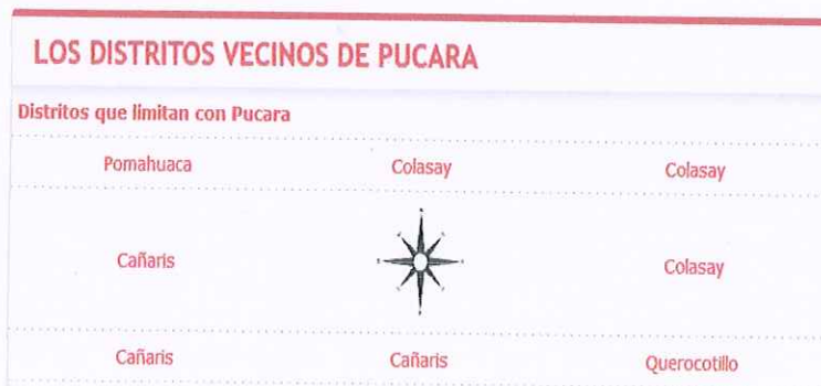
MAPA N° 01: DISTRITO DE PUCARÁ