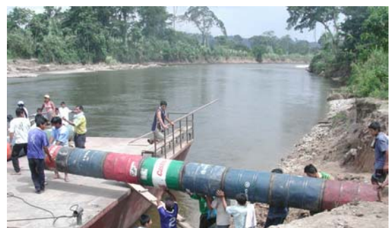
Agricultores transportando ductos para Sistema de Riego Huasta