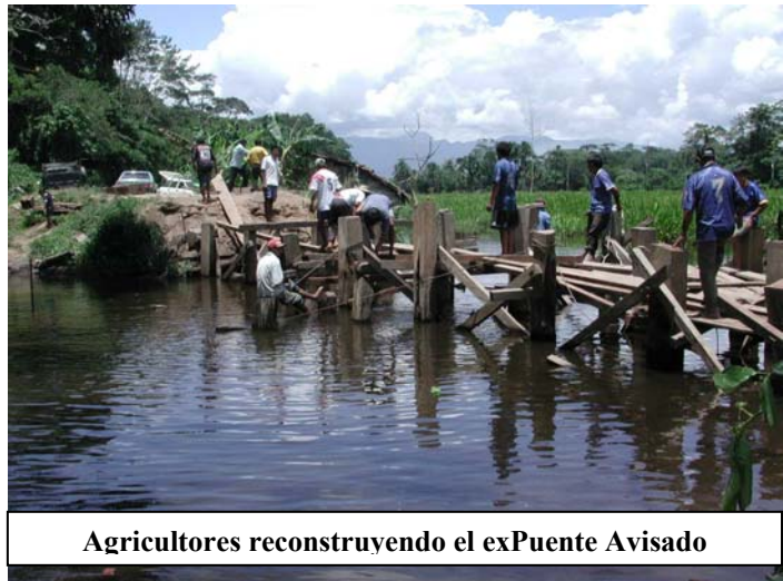
Agricultores reconstruyendo el exPuente Avisado