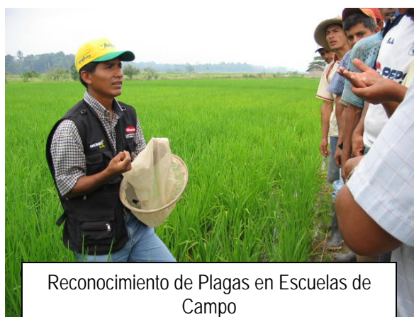
Reconocimiento de Plagas en Escuelas de Campo