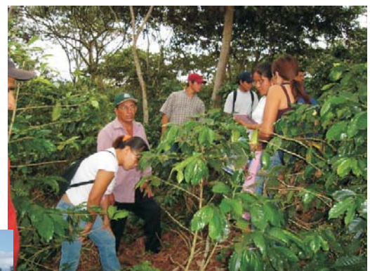
Parcela manejo de cafe Cuenca rio Rumiayacu