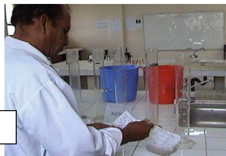
Laboratorio de Suelos

Laboratorio de Suelos continúa brindando servicios a usuarios, así como a las actividades de la DDA y a productores del Alto Mayo.