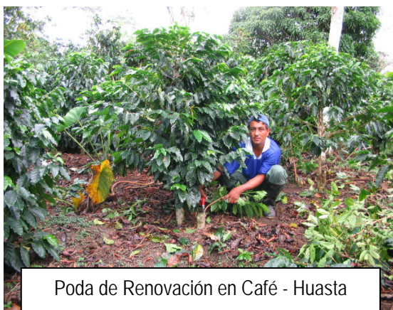
Poda de Renovación en Café - Huasta