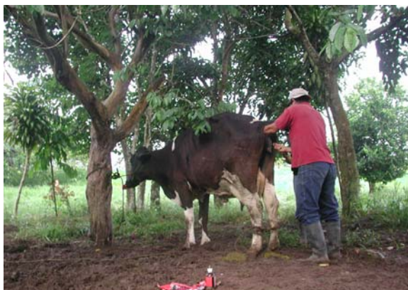
Detectando preñez de una vaca - San Marcos