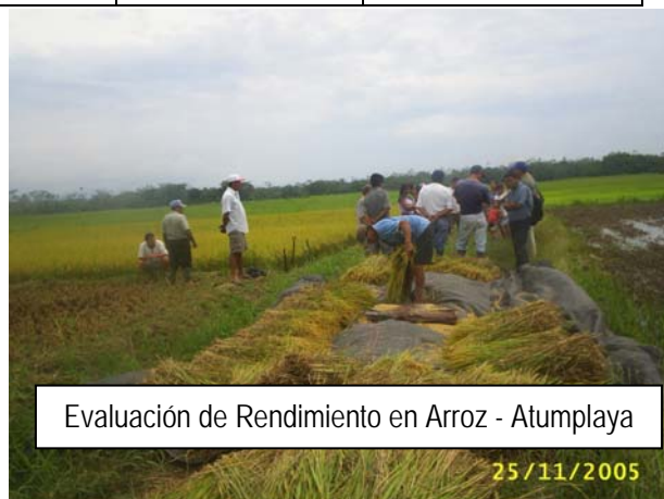
Evaluación de Rendimiento en Arroz - Atumplaya