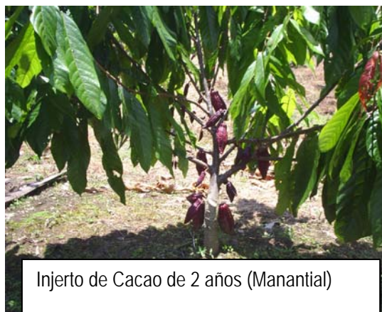
Injerto de Cacao de 2 años (Manantial)