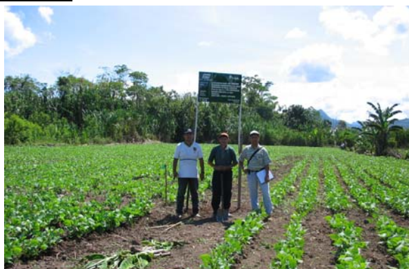
Parcela de Investigación de Menestras - Huasta