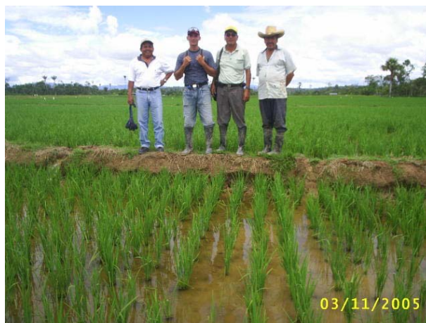
Semillero de Nueva Variedad de Arroz

Arroz cáscara y arroz pilado : El año 2005, mostró una tendencia a la baja de ambos tipos de arroz, por factores fundamentales del mercado : sobre producción, importación y especulación.