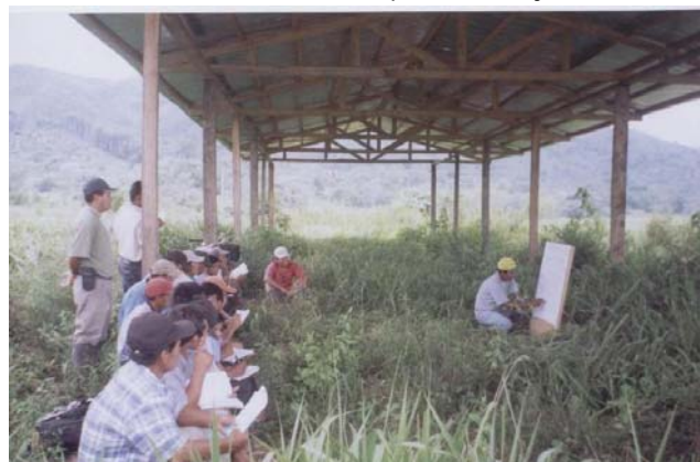
Seguimiento Actividades del PDA (ECAS)