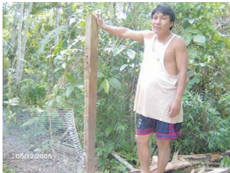
Monitoreo de actividades- Manejo ambiental