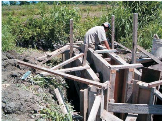
Mejoramiento de Canales de Riego: Laterales Alto Mayo