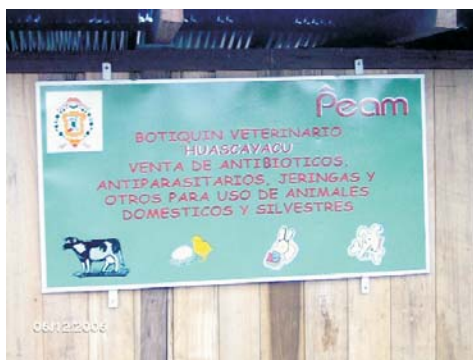
Botiquin comunal CC.NN. Huascayacu