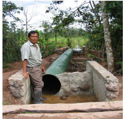
Instalación de Coloches La Cruz - Huasta