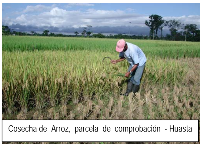
Cosecha de Arroz, parcela de comprobación - Huasta