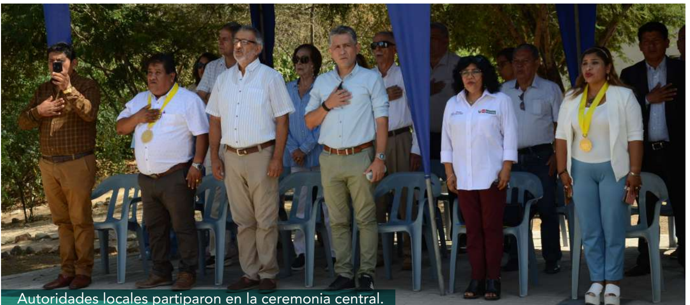
Autoridades locales participaron en la ceremonia central.