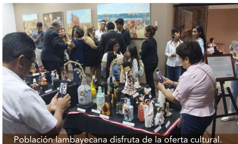
Población lambayecana disfruta de la oferta cultural.