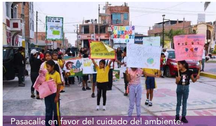
Pasacalle en favor del cuidado del ambiente.

En la actividad destacó la masiva presencia de docentes, estudiantes y padres de familia, para resaltar la importancia de la cultura local en la protección y mantenimiento de espacios comunes.