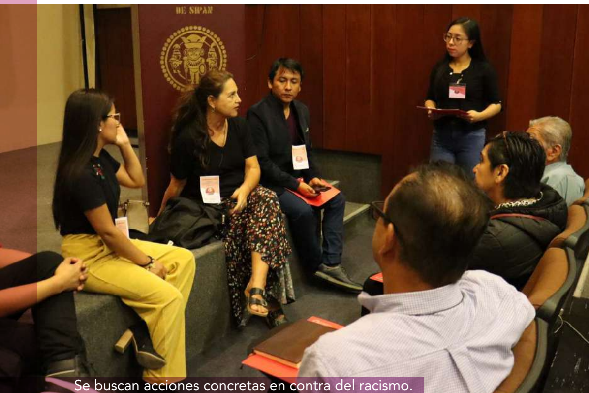
Se buscan acciones concretas en contra del racismo.