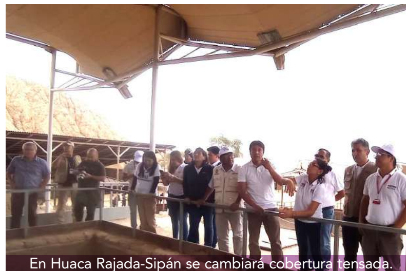
En Huaca Rajada-Sipán se cambiara cobertura tensada.