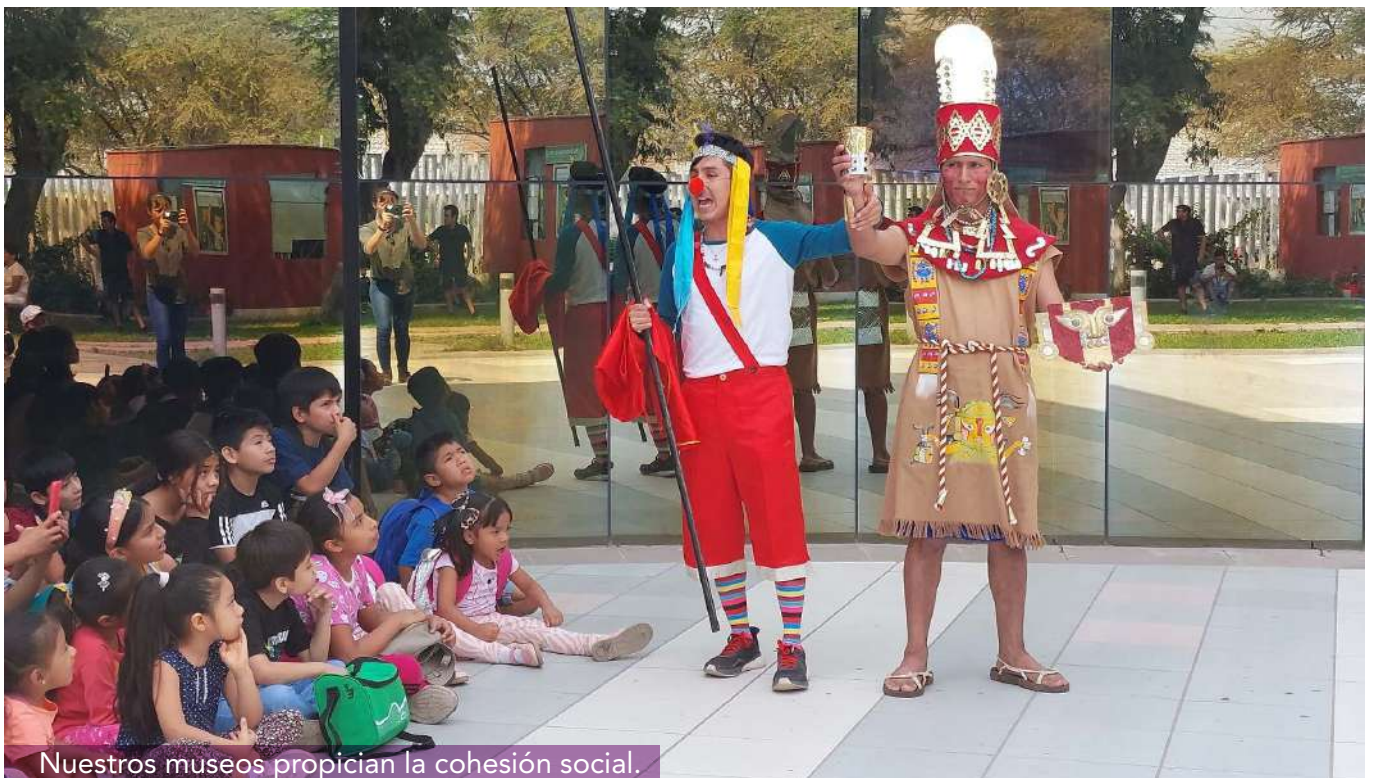
Nuestros museos propician la cohesión social.

Los museos actúan no solo como guardianes del pasado, sino también como puentes hacia un futuro más prometedor.