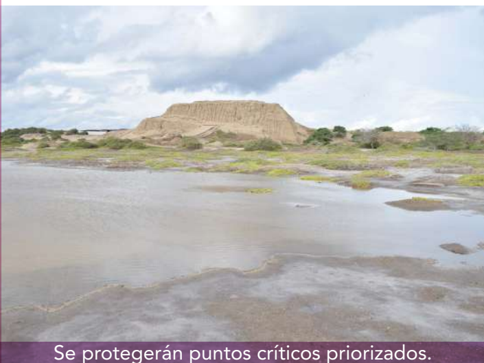
Se protegerán puntos críticos priorizados.

Por otro lado, la ministra visitó Huaca Santa Rosa de Pucalá. "Vamos a darle difusión con las respectivas medidas de protección y preservación [...] Pucalá es un ejemplo de la diversidad cultural desde su historia, arqueología y ancestros", comentó.