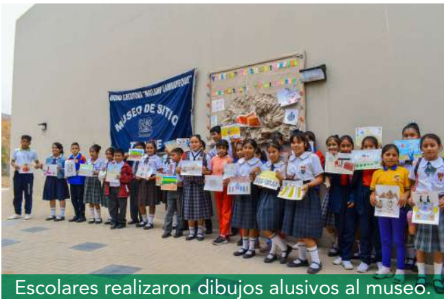
Escolares realizaron dibujos alusivos al museo.