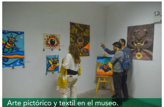
Arte pictórico y textil en el museo.