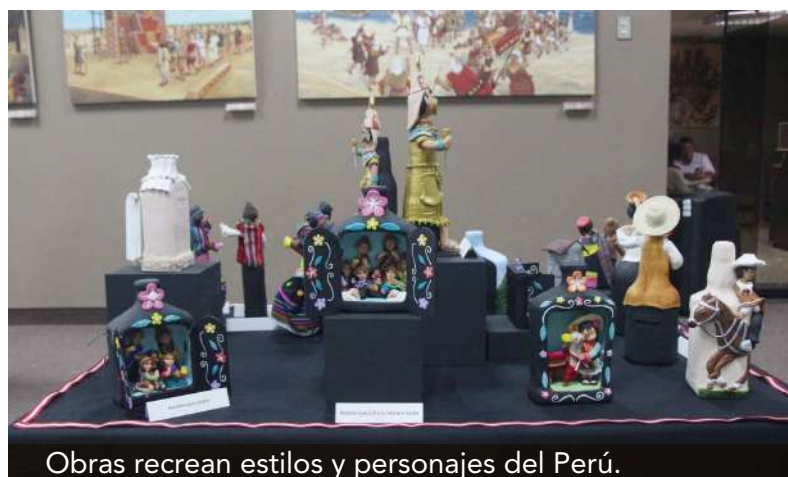
Obras recrean estilos y personajes del Perú.

La muestra se consolida como un espacio de celebración y reflexión sobre la riqueza cultural del país, y evidencia el compromiso del Museo Brüning con la promoción del arte y la historia peruana.