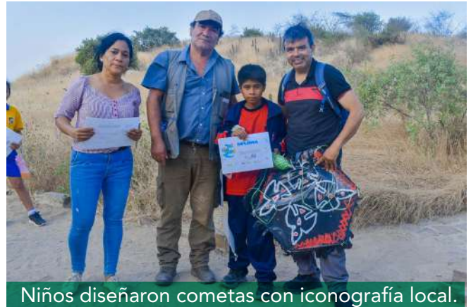
Niños diseñaron cometas con iconografía local.

Por otro lado, el evento incluyó el relanzamiento de la biblioteca del museo y el VI Concurso de Cometas. En el ámbito espiritual, se celebró una reunión de trabajo con maestros curanderos, enmarcada en los Acuerdos KONTUC 2024.