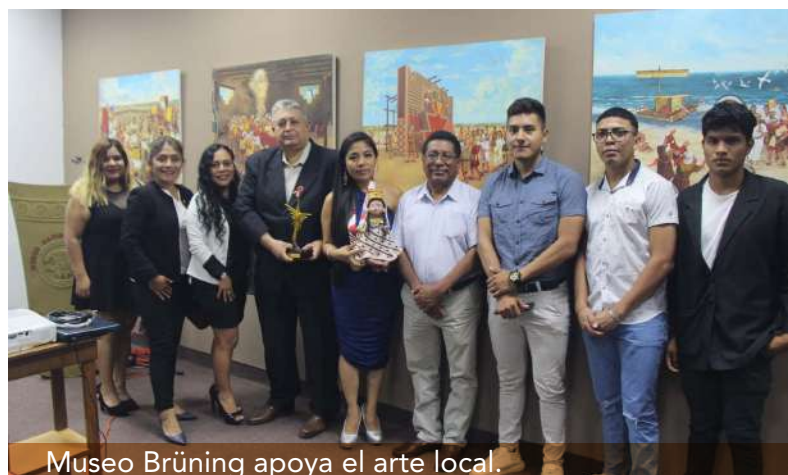
Museo Brüning apoya el arte local.