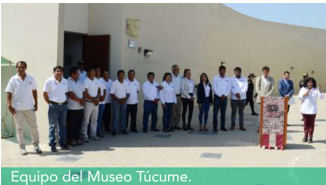
Equipo del Museo Túcume.

Con esta diversidad de actividades, el Museo Túcume celebró su aniversario y reafirmó su compromiso con la educación, la cultura y el bienestar de la comunidad.