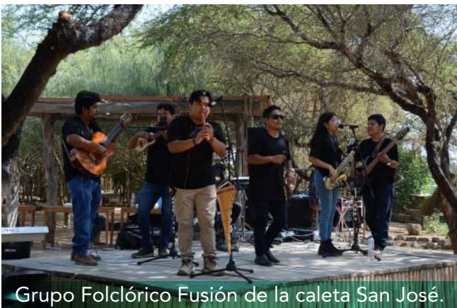
Grupo Folclórico Fusión de la caleta San José.

El festival cultural cerró las festividades con presentaciones de los grupos musicales Folclórico Fusión de la caleta San José y Tracking Sound de Chiclayo.