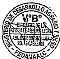
PROYECTO: “Mejoramiento y ampliación incremento del nivel de producción de cultivo de cacao en la localidad de Mamayaque y Anexos, Centro Poblado de Kayamas – Centro Poblado de Sujin – Centro Poblado de Mamayaque - Distrito de El Cenepa – Provincia de Concordanqui – Región Amazonas”