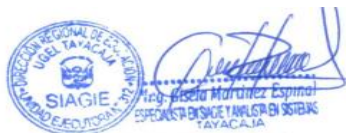
JURADO N° 02