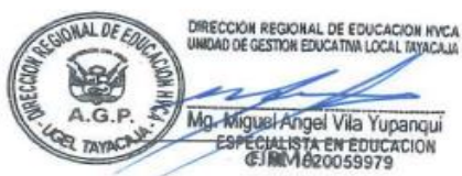
JURADO N° 01