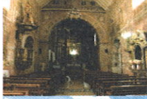
TEMPLO COLONIAL DE INMACULADA CONCEPCION DE ANTA