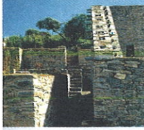
TEMPLO COLONIAL DE SAN MARTIN DE TUR HUAROCONDO