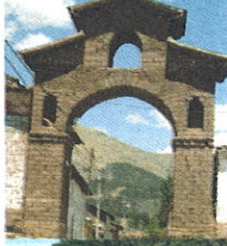
SITIO ARQUEOLOGICO DE TARAWASI