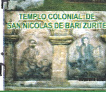
TEMPLO COLONIAL DE SAN NICOLAS DE BARI ZURITE