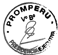
JUAN CARLOS MATHEWS SALAZAR Ministro de Comercio Exterior y Turismo