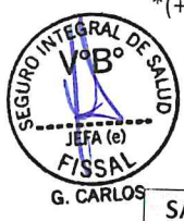
Cuadro N° 2. Conciliación de Prestaciones de Salud y Administrativas – No Tarifado Unidad Ejecutora: 132 - HOSPITAL NACIONAL HIPOLITO UNANUE

*(+): Saldo a favor del FISSAL, (-): Saldo a favor de la Unidad Ejecutora