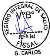
Cuadro N° 5. Conciliación de Prestaciones de Salud y Administrativas – No Tarifado Unidad Ejecutora: 137 - HOSPITAL CAYETANO HEREDIA

*(+): Saldo a favor del FISSAL, (-): Saldo a favor de la Unidad Ejecutora