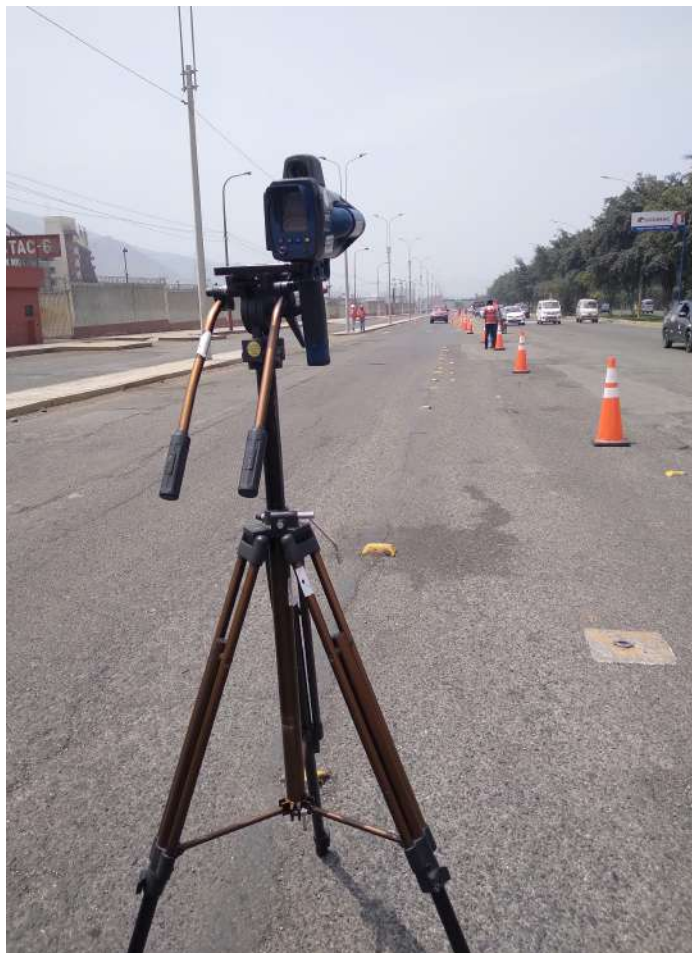
ILUSTRACIÓN DEL MEDIDOR DE VELOCIDAD PORTÁTIL CON NÚMERO DE SERIE TC003638