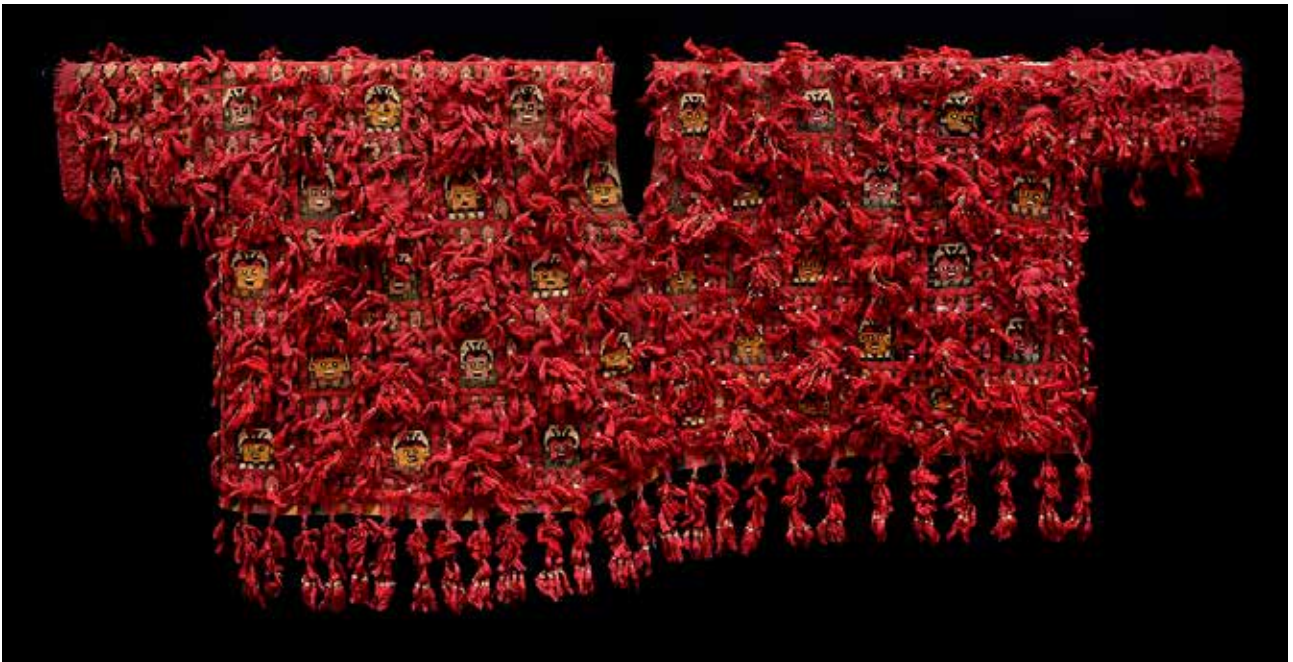
Cultura Chancay: unku , y, abajo, red con motivos de peses

tracción en las figuras de los textiles que envolvían los fardos funerarios, y el simbolismo religioso, de resonancias orientales, de los llamados cuchimilcos , esas enigmáticas figuras de arcilla con los brazos en posición de ofrenda y los ojos rasgados, que algunos hijos de hacendados usaban en ocasiones para jugar tiro al blanco.