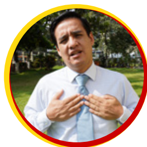
Complicación para respirar