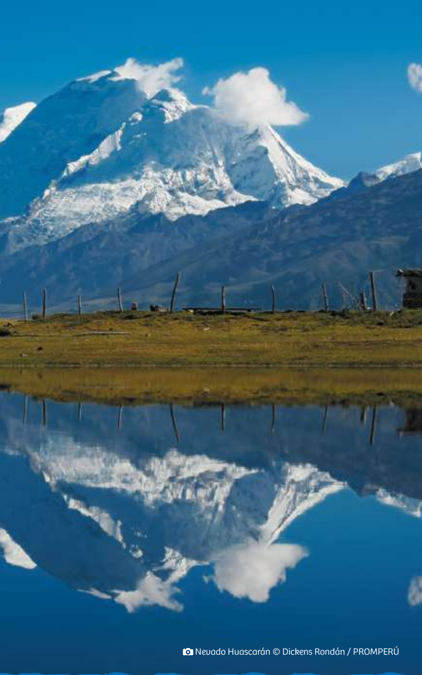
📷 Neuado Huascarán