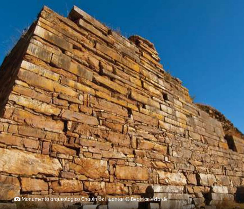
📷 Monumento arqueológico Chavín de Huántar