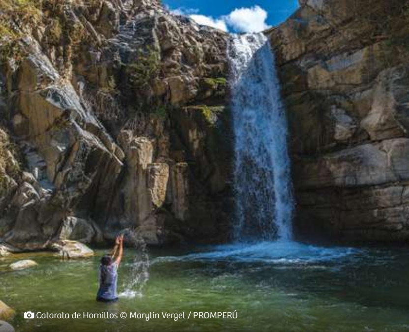
📷 Catarata de Hornillos