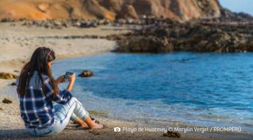
Playa de Huarmey