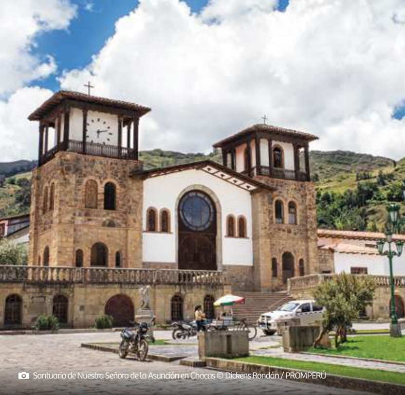
📷 Santuario de Nuestra Señora de la Asunción en Chacas