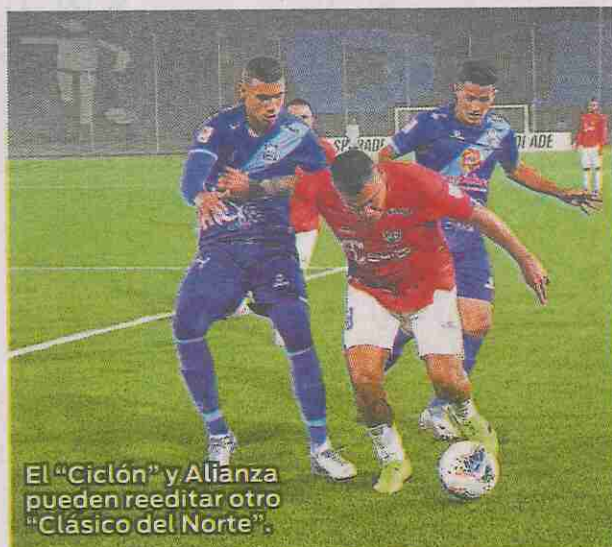
El "Ciclón" y Alianza pueden reeditar otro "Clásico del Norte".

fecha para el encuentro del "Clásico del norte" sería durante las fechas FIFA. Cabe señalar que los "rojos" de Chiclayo, en su último