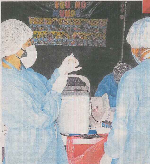
La falta de vacunados es preocupante.