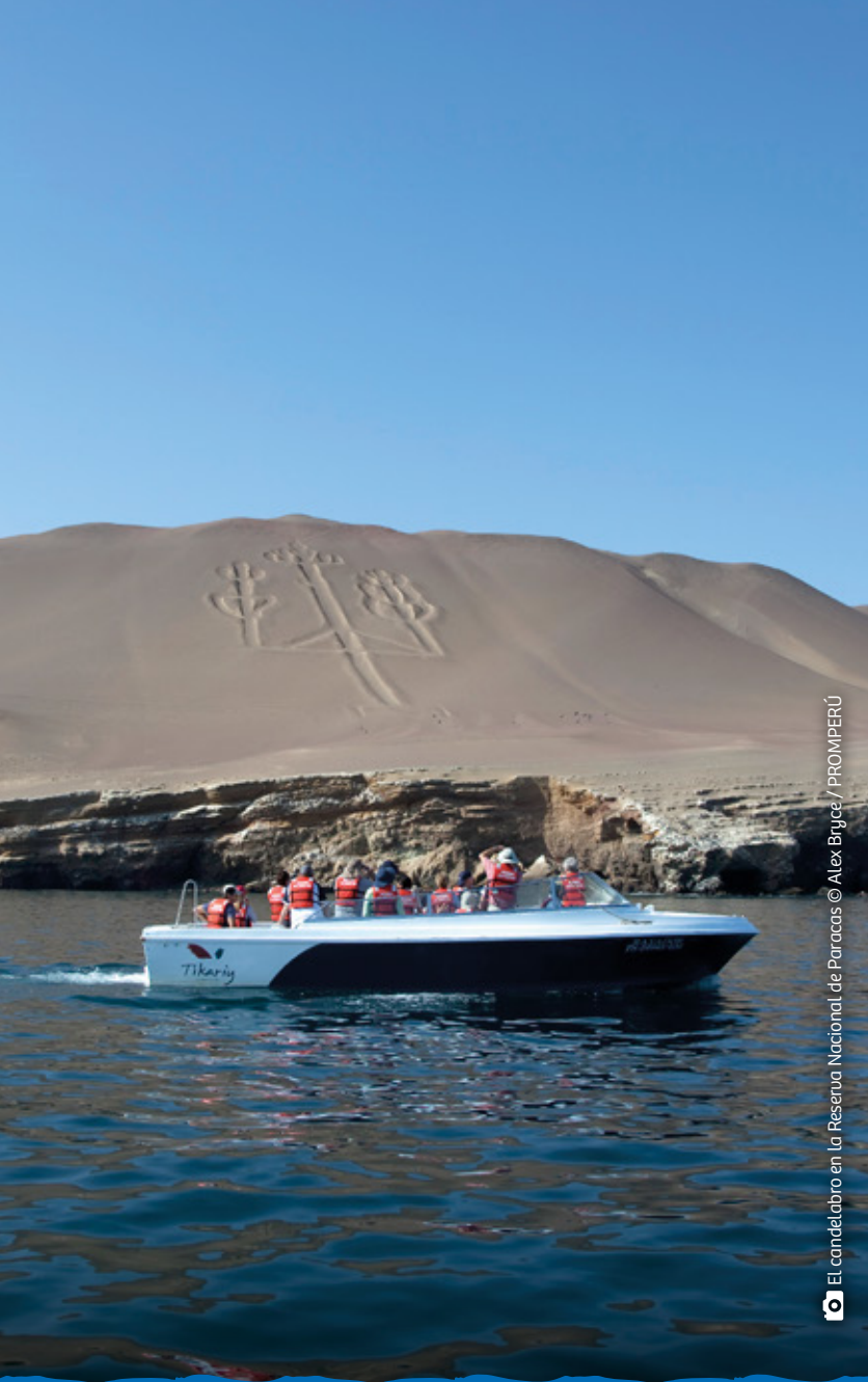
El candelabro en La Reserva Nacional de Paracas