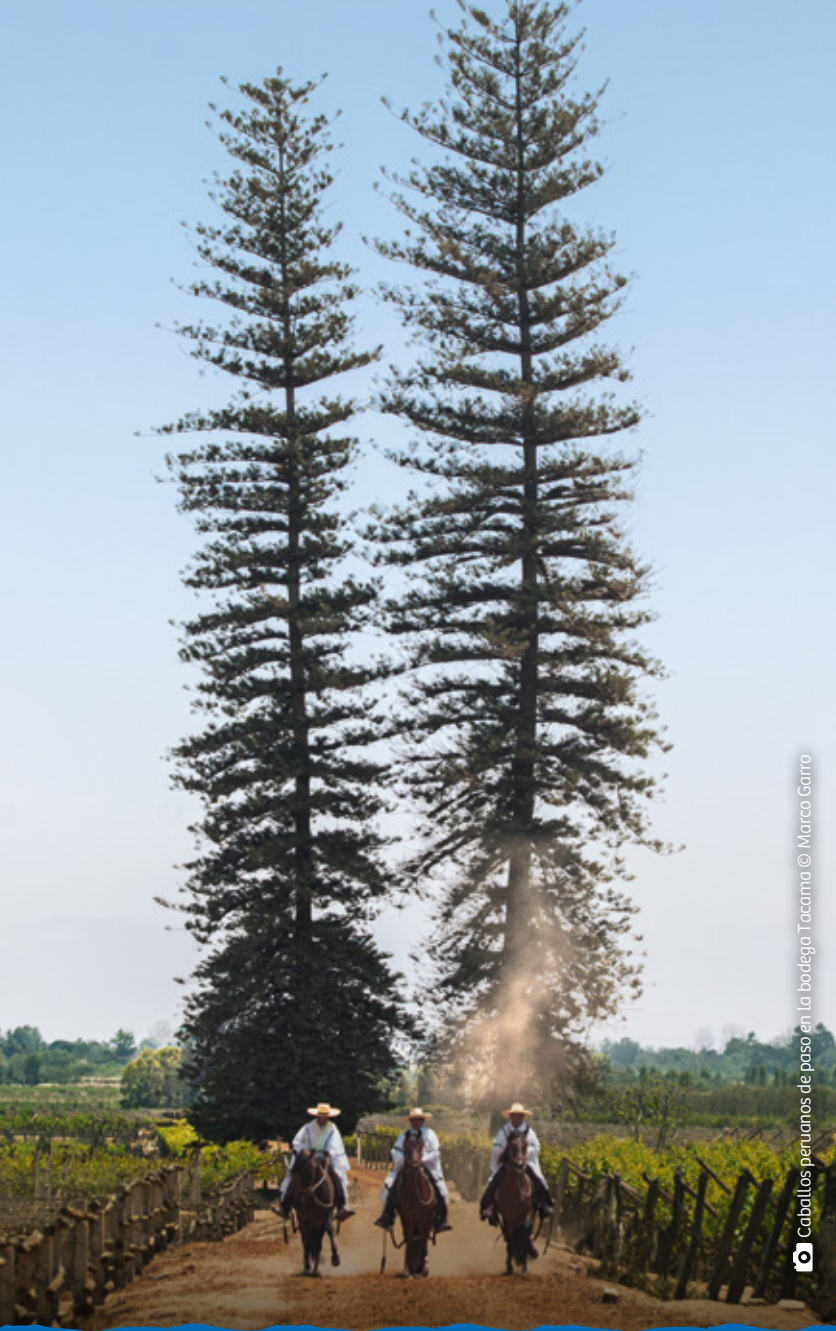
📷 Caballos peruanos de paso en la bodega Tacama