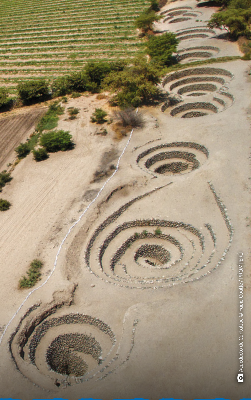
Acueducto de Cantalloc