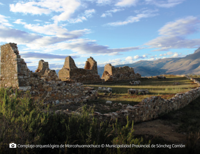
📷 Complejo arqueológico de Marcahuamachuco