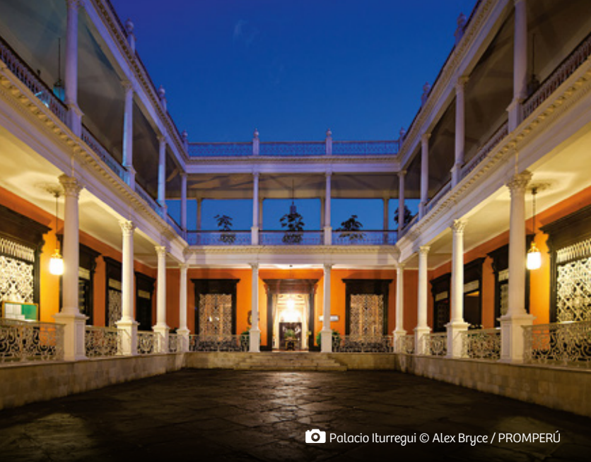
📷 Palacio Iturregui