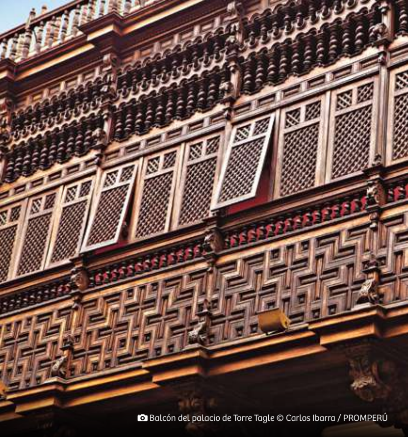
📹 Balcón del palacio de Torre Tagle