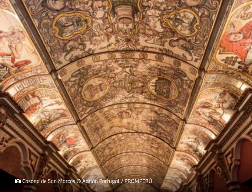
📷 Casona de San Marcos © Adrián Portugal / PROMPERÚ