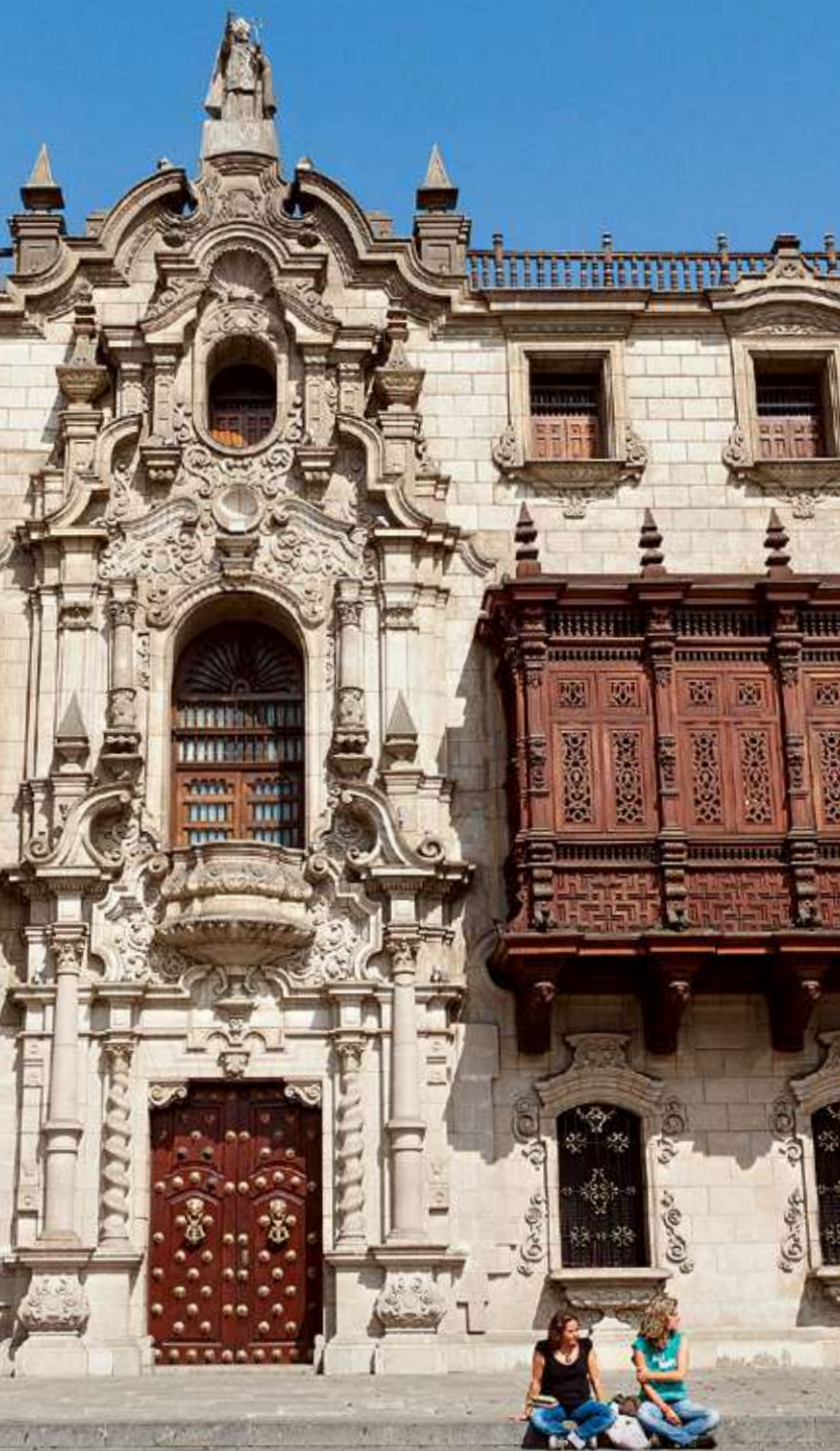
Palacio Argobispal (Centro Histórico de Lima)