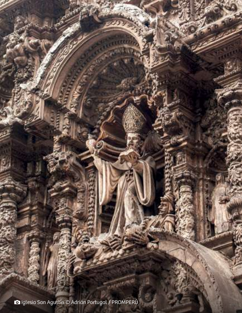
📷 Iglesia San Agustín