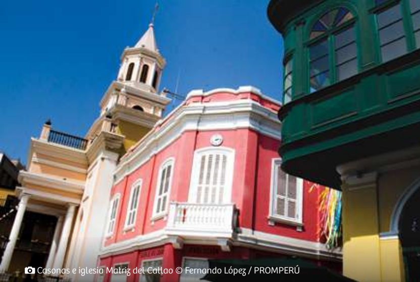
📷 Casonas e iglesia Matriz del Callao