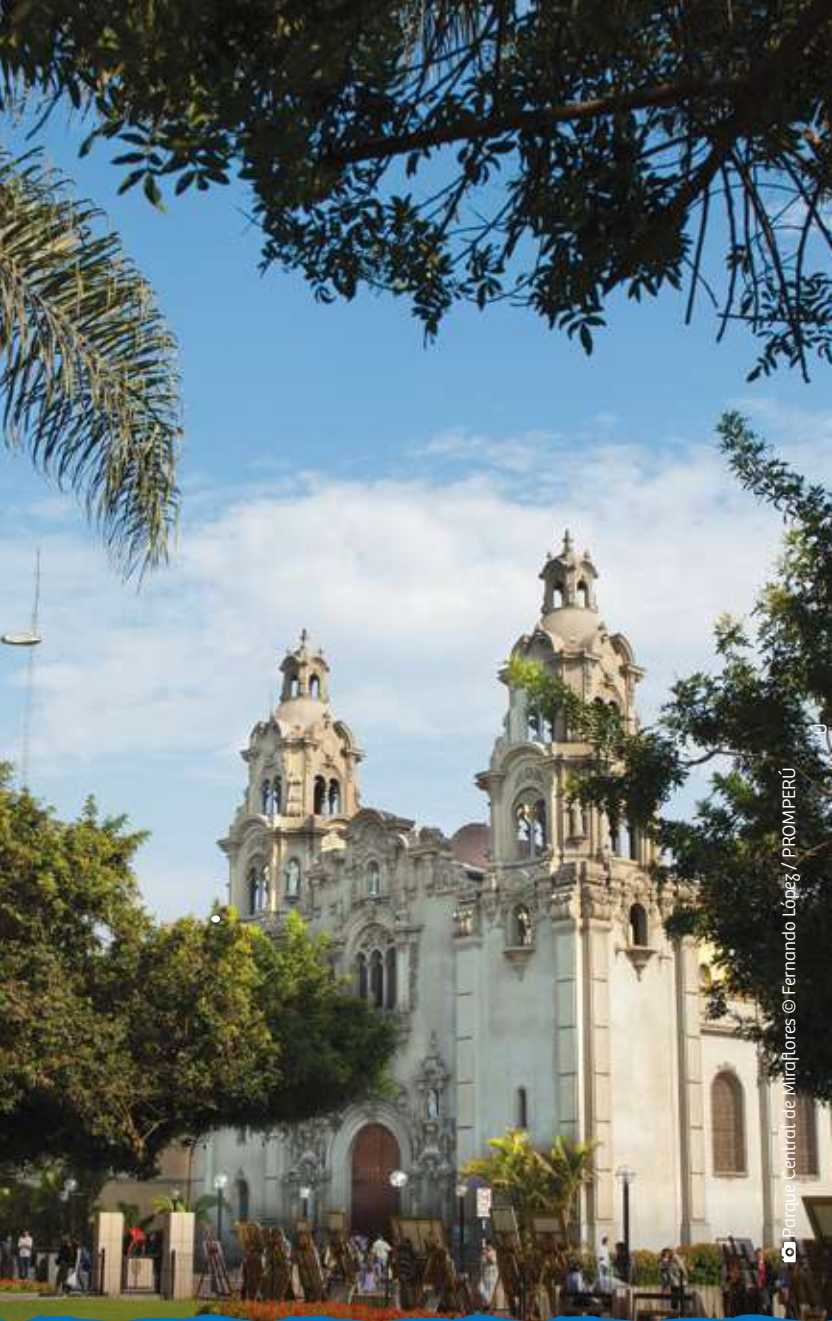
Parque Central de Miraflores