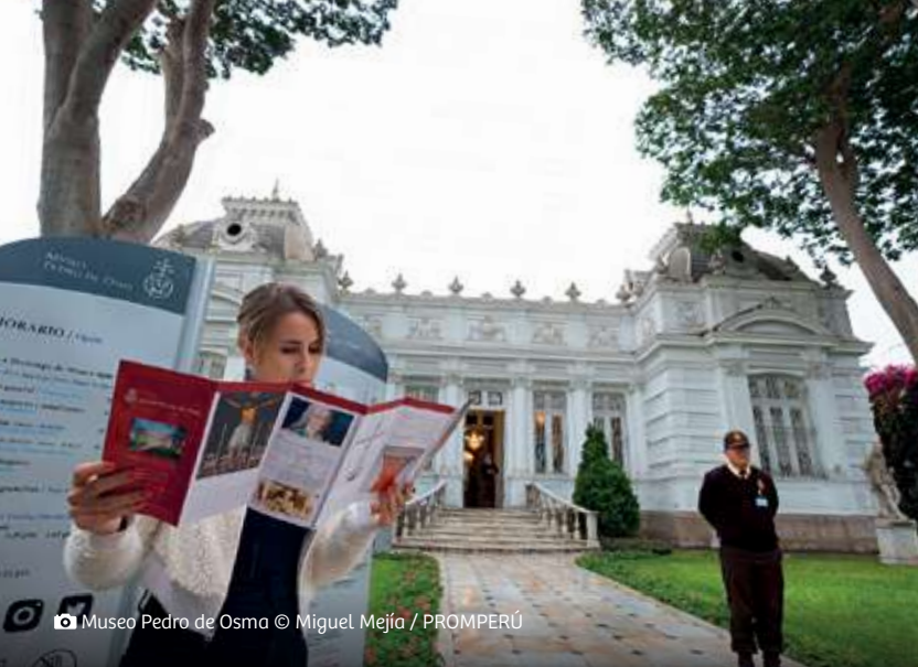
Museo Pedro de Osma